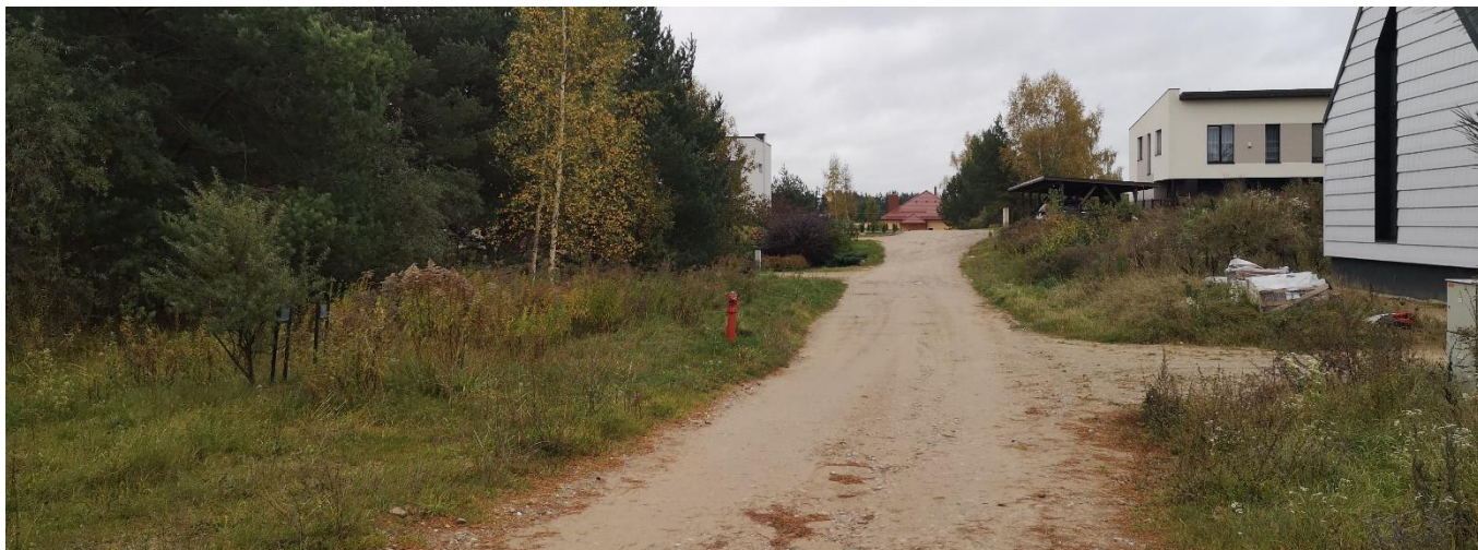
Foto fikscija Nr. 4. Aušrinės gatvė pietų kryptimi