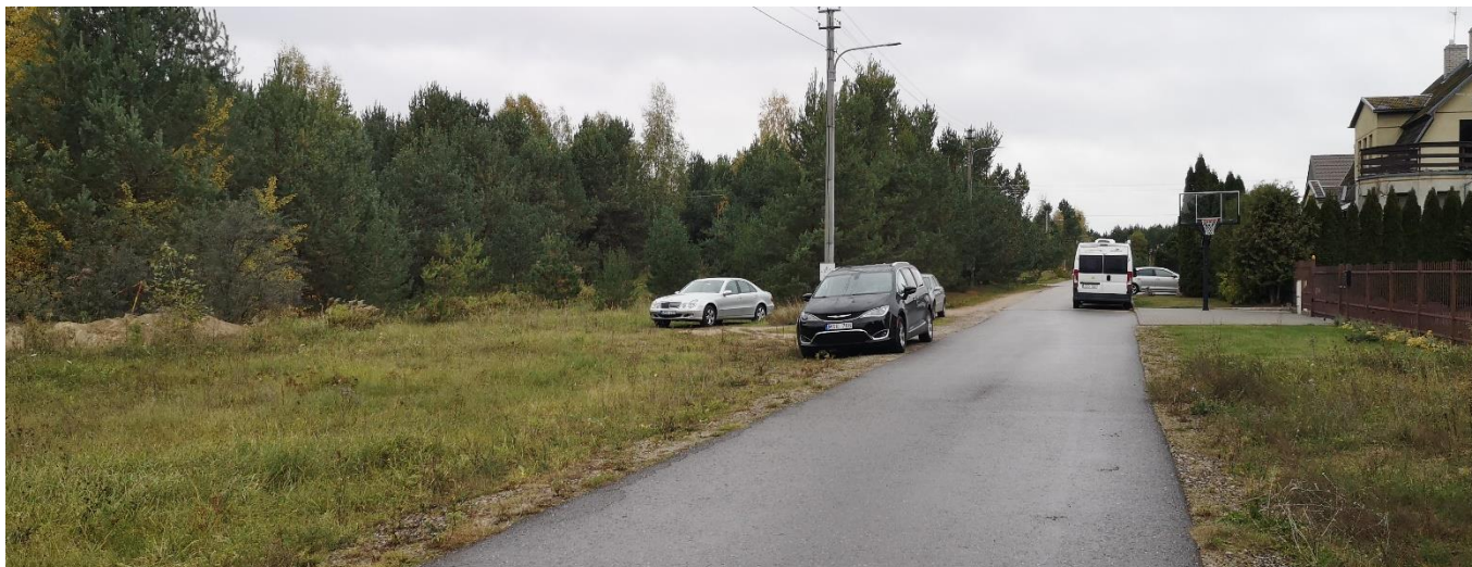
Foto fiksacija Nr. 10. Vaidevučio gatvė šiaurės kryptimi