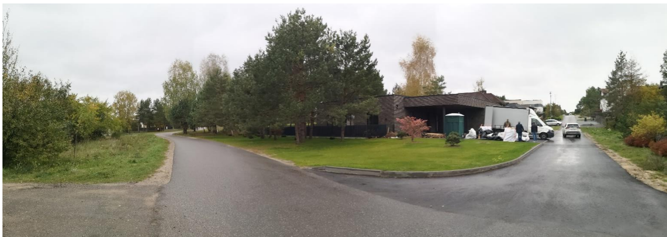
Foto fiksacija Nr. 7. Vaidevučio ir Bulvikio gatvių sankryža šiaurės vakarų kryptimi