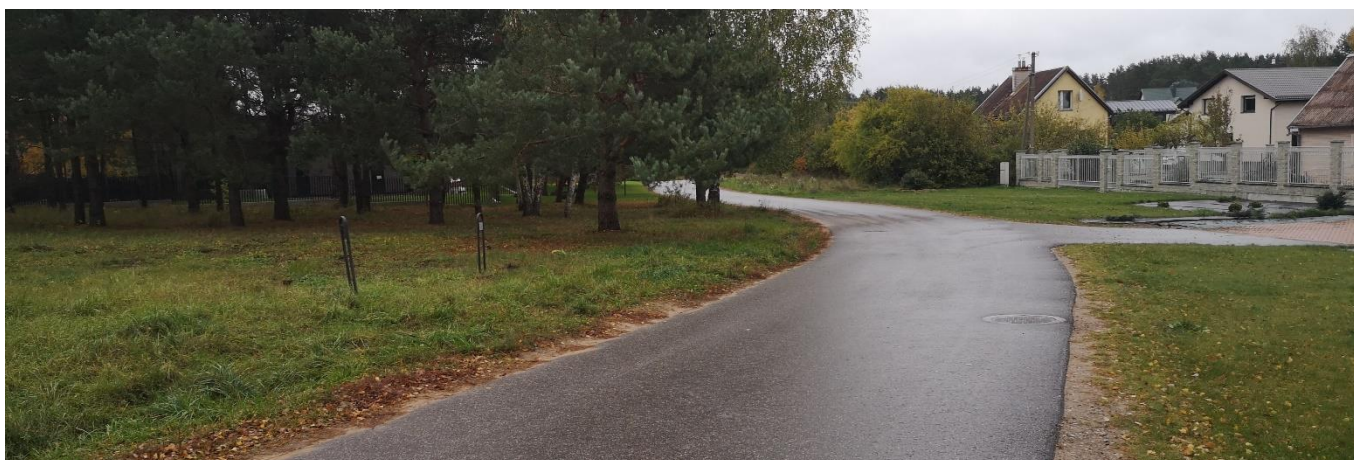
Foto fikscija Nr. 6. Bulvikio gatvė rytų kryptimi