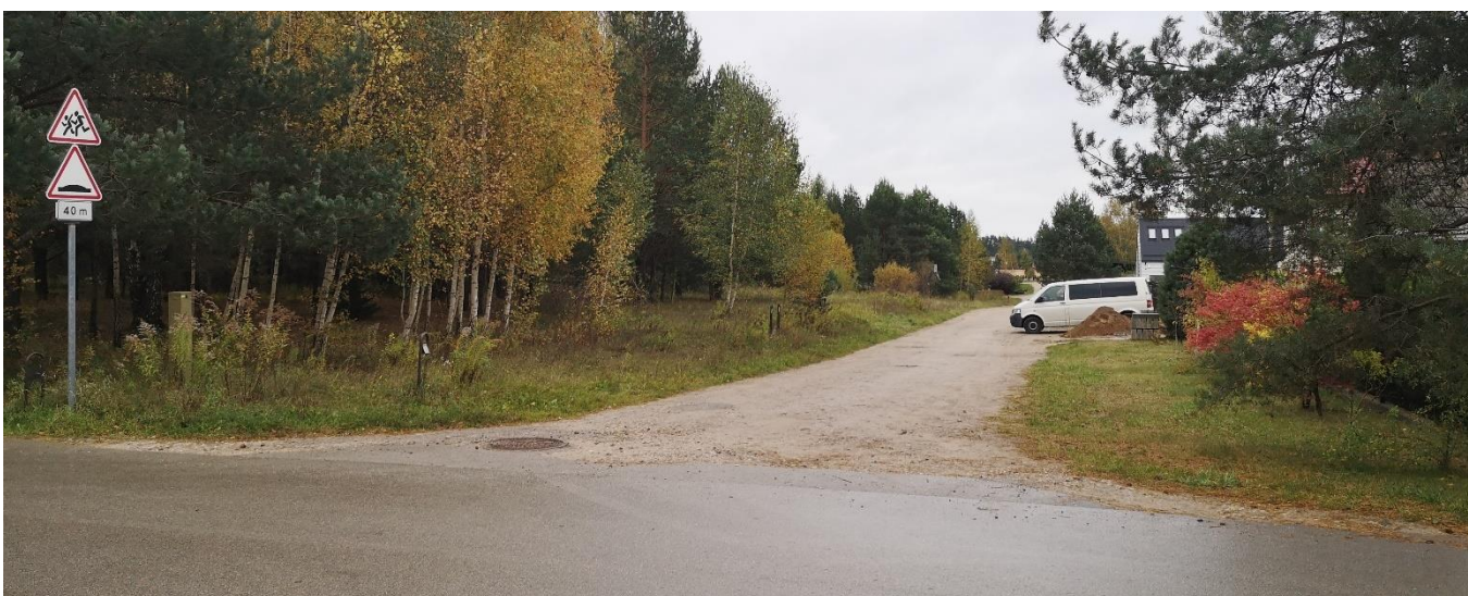
Foto fiksacija Nr. 2. Aušrinės gatvės sankryža su Jundos gatve pietų kryptimi