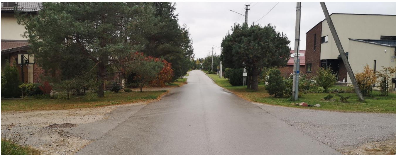
Foto fiksacija Nr. 1. Jundos gatvės sankryža su Aušrinės gatve rytų kryptimi