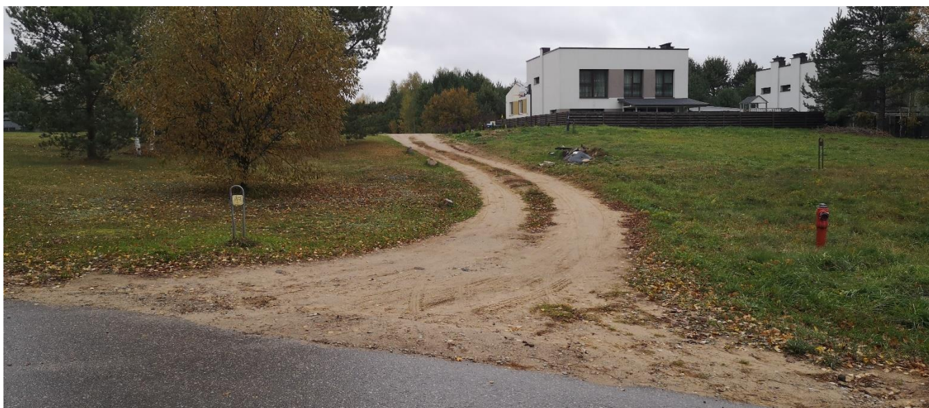
Foto fikscija Nr. 5. Aušrinės gatvės sankryža su Bulvikio gatve šiaurės kryptimi