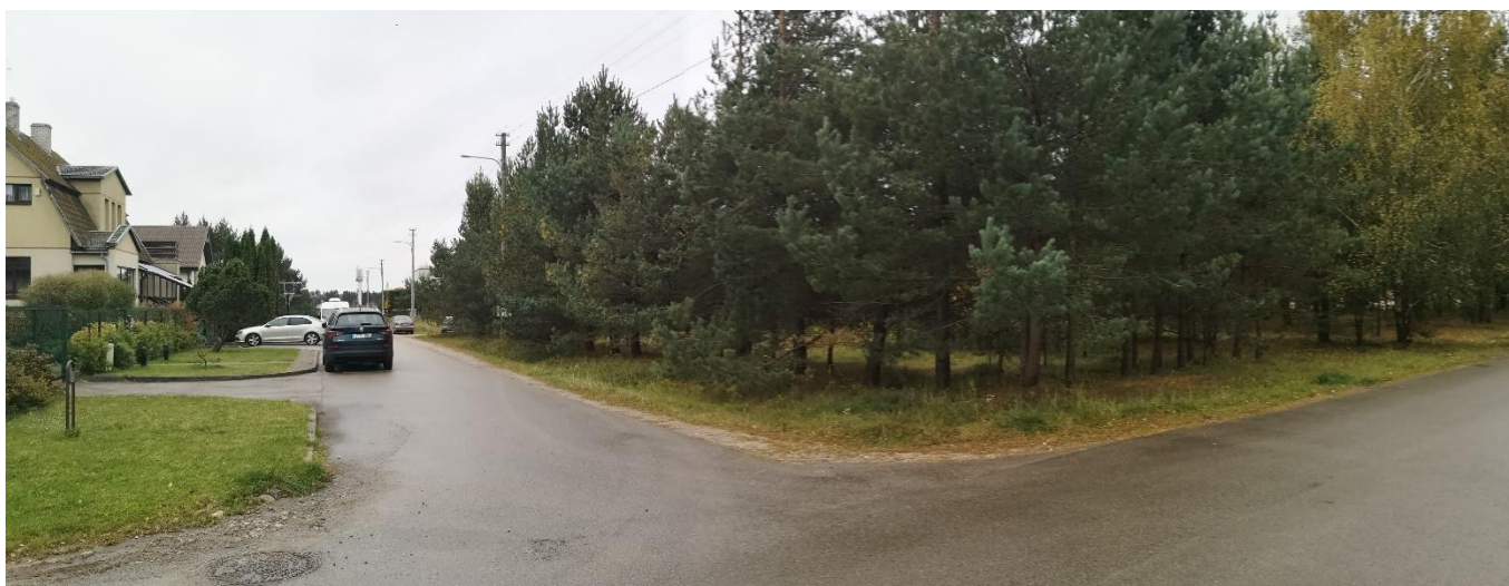
Foto fiksacija Nr. 11. Vaidevučio ir Jundos gatvių sankryža pietvakarių kryptimi