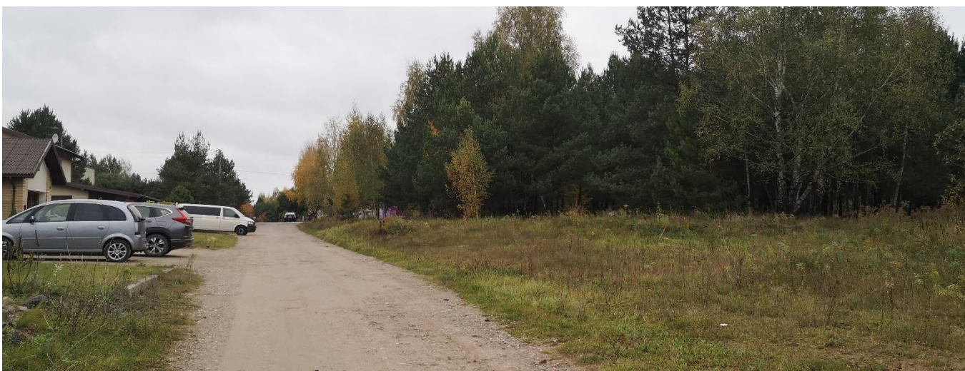
Foto fiksacija Nr. 3. Aušrinės gatvė šiaurės kryptimi