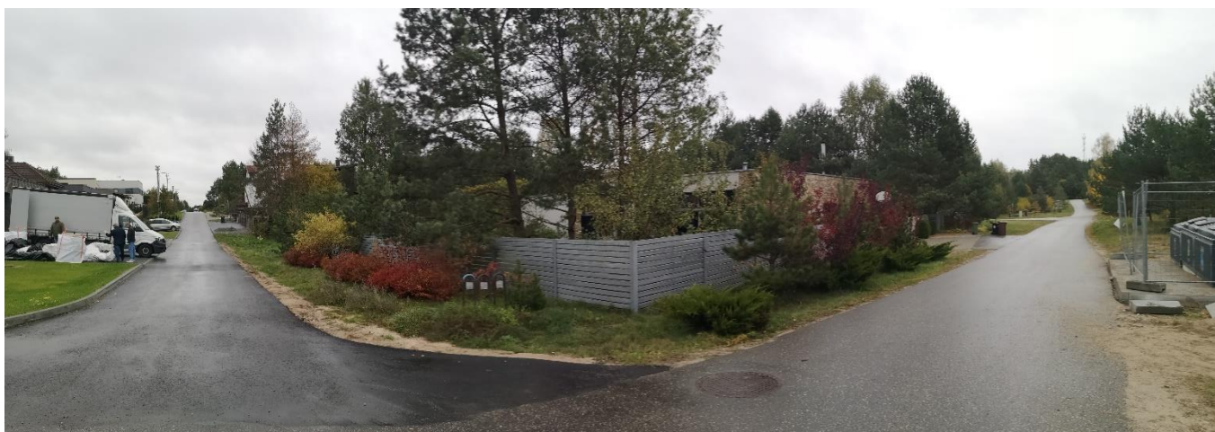
Foto fiksacija Nr. 8. Vaidevučio ir Bulvikio gatvių sankryža šiaurės rytų kryptimi