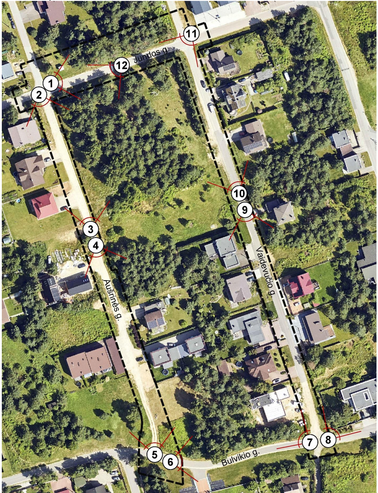
Foto fiksacijų schema