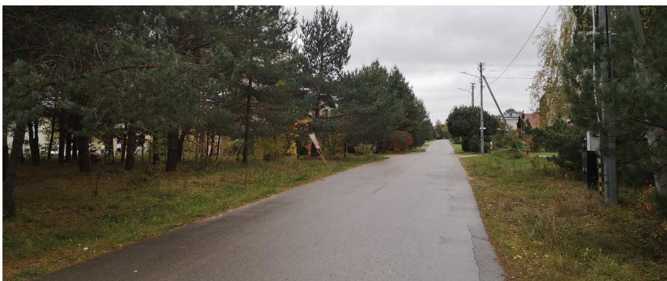
Foto fiksacija Nr. 12. Jundos gatvė vakarų kryptimi