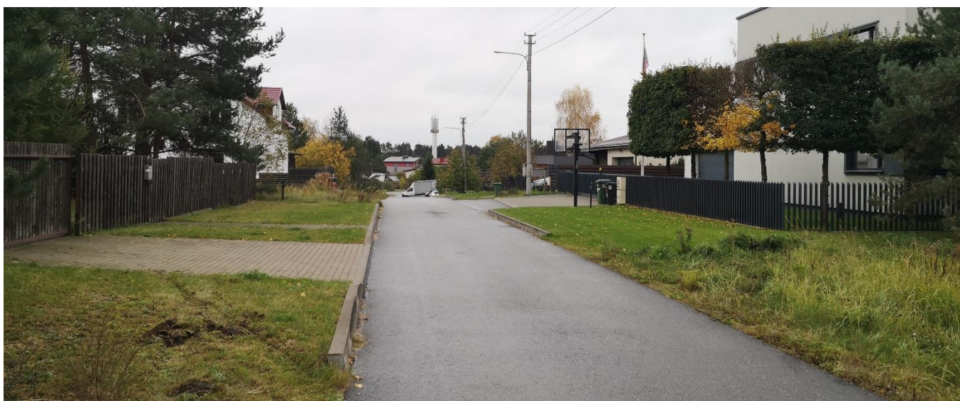
Foto fiksacija Nr. 9. Vaidevučio gatvė pietų kryptimi