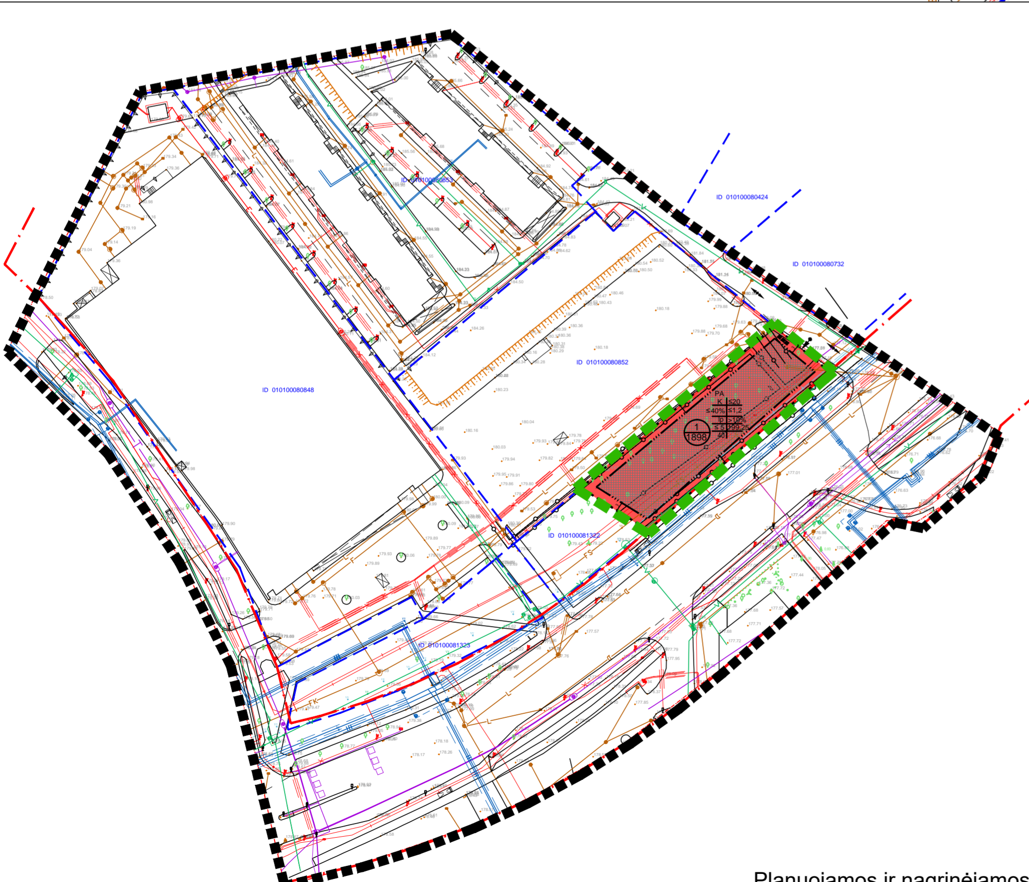
Planuojamos ir nagrinėjamos teritorijos schema