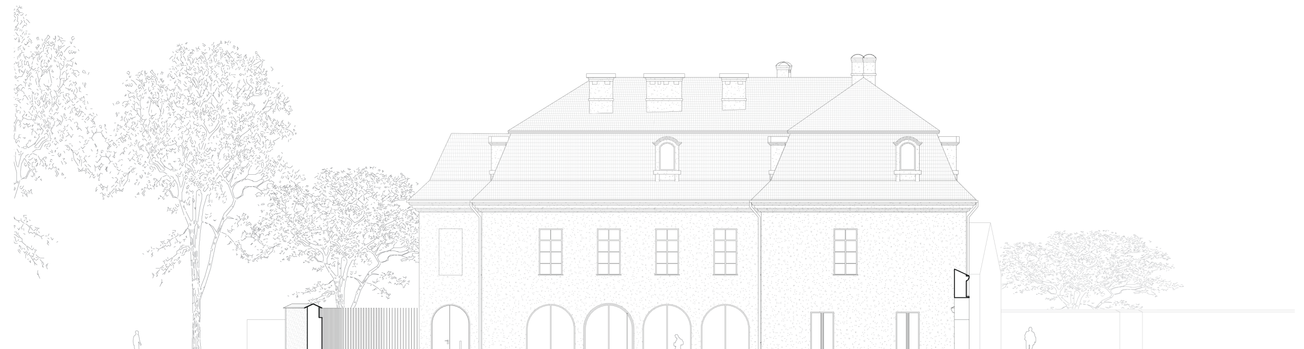
Pjūvis E-E M1:200