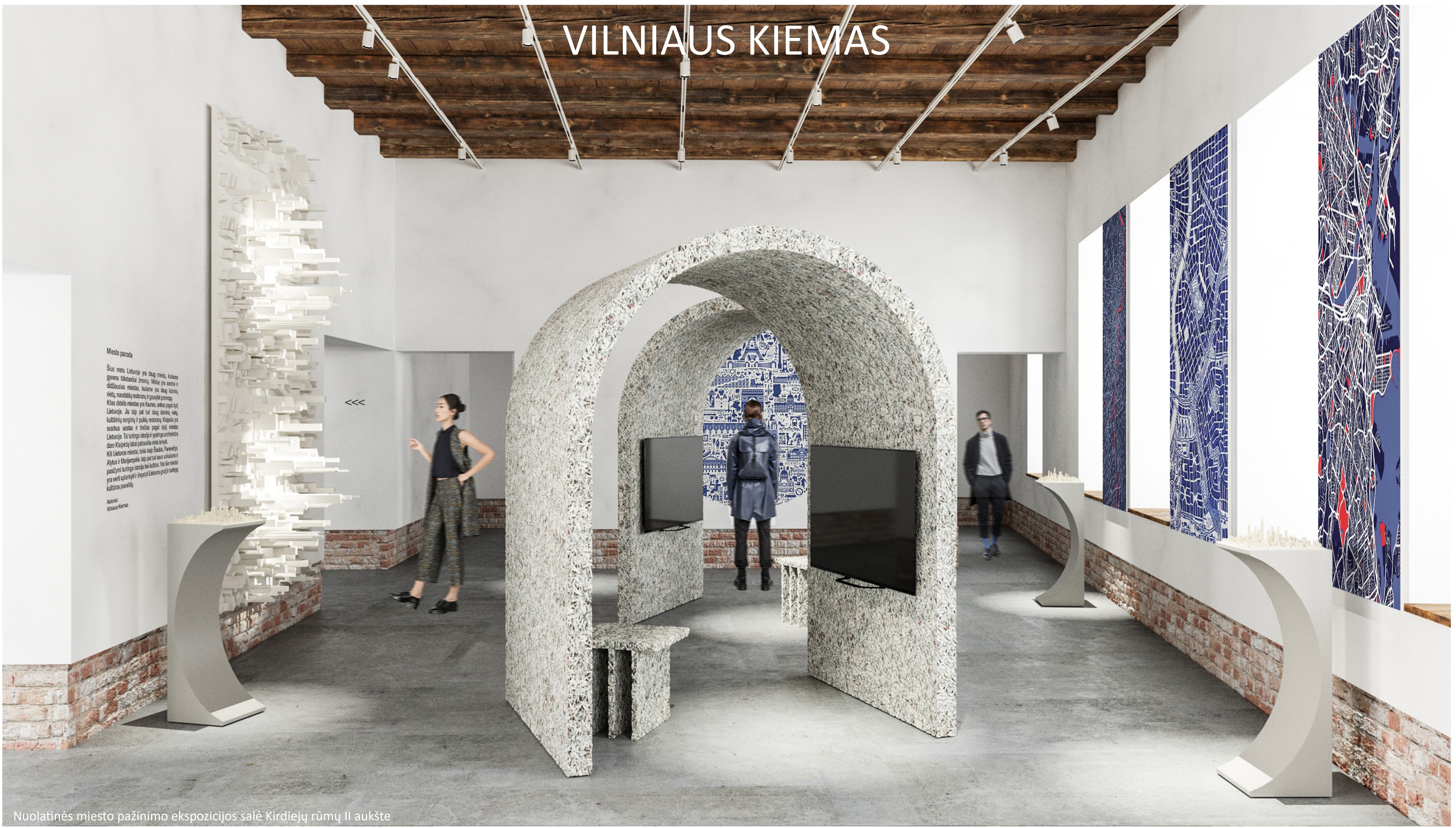
Nuolatinės miesto pažinimo ekspozicijos salė Kirdiejų rūmų II aukšte