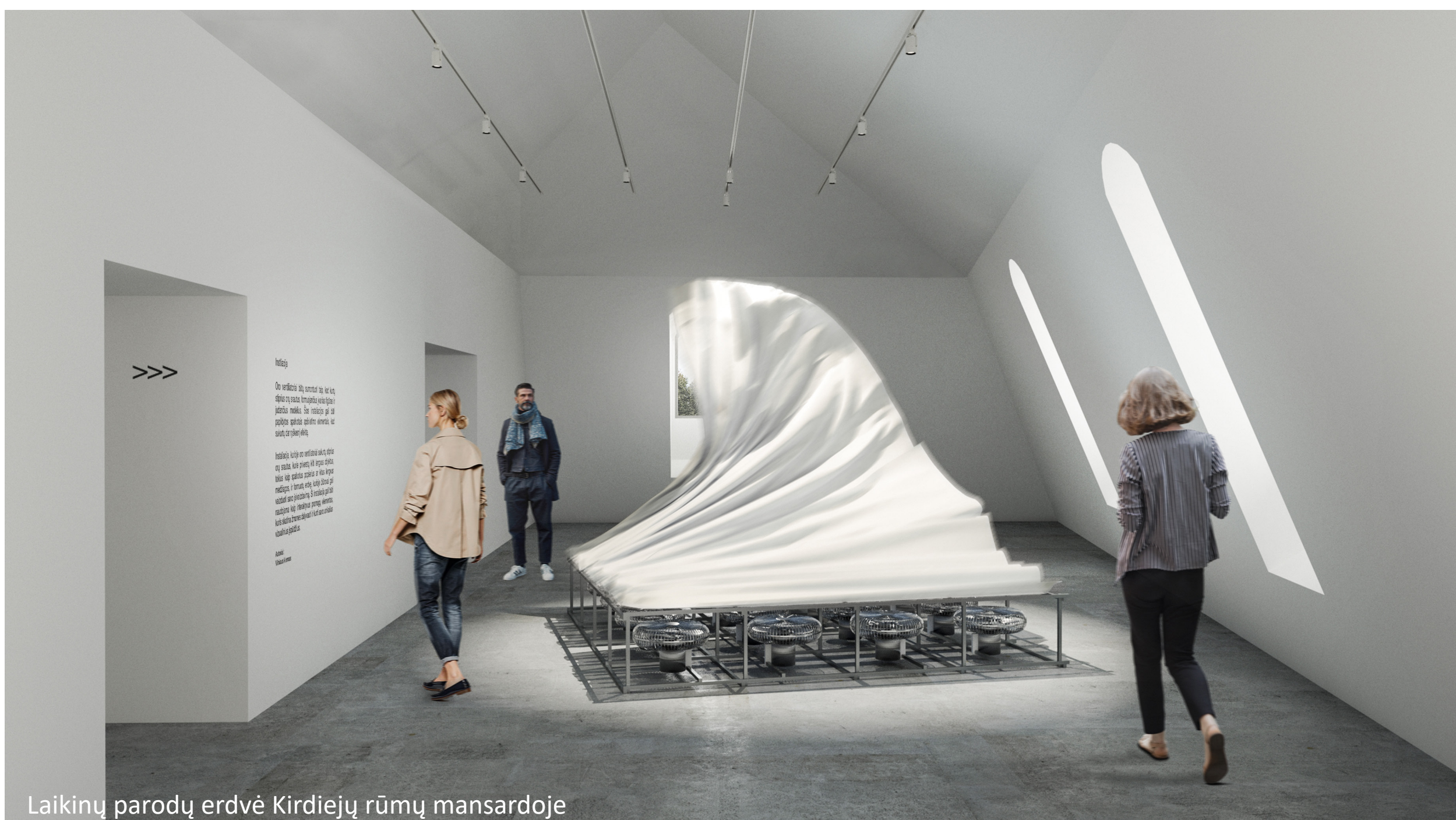
Laikinių parodų erdvė Kirdiejų rūmų mansardoje