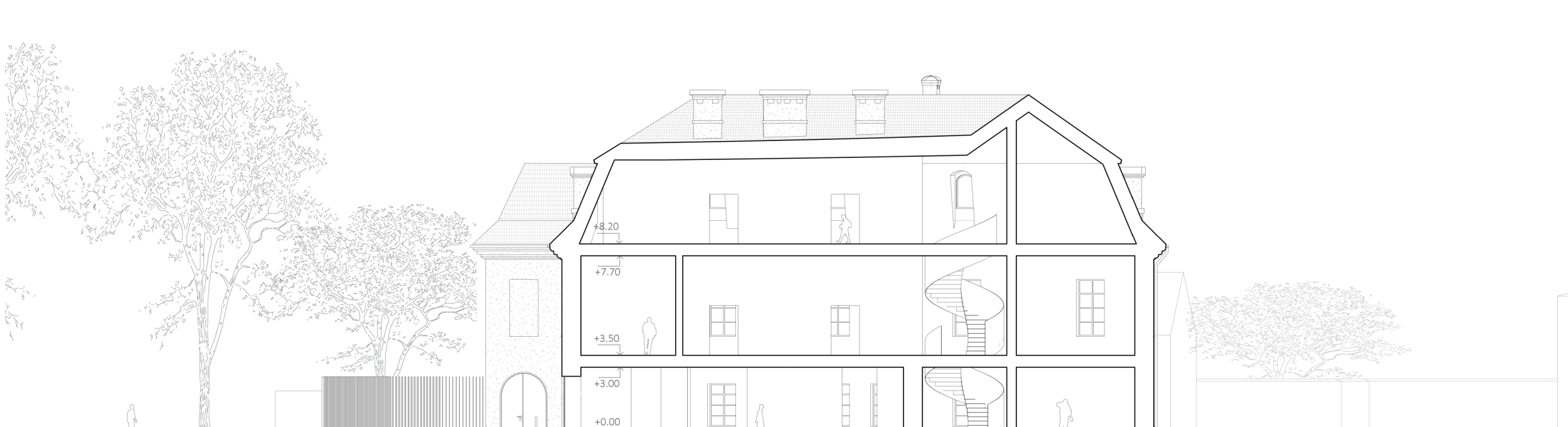
Pjūvis D-D M1:200