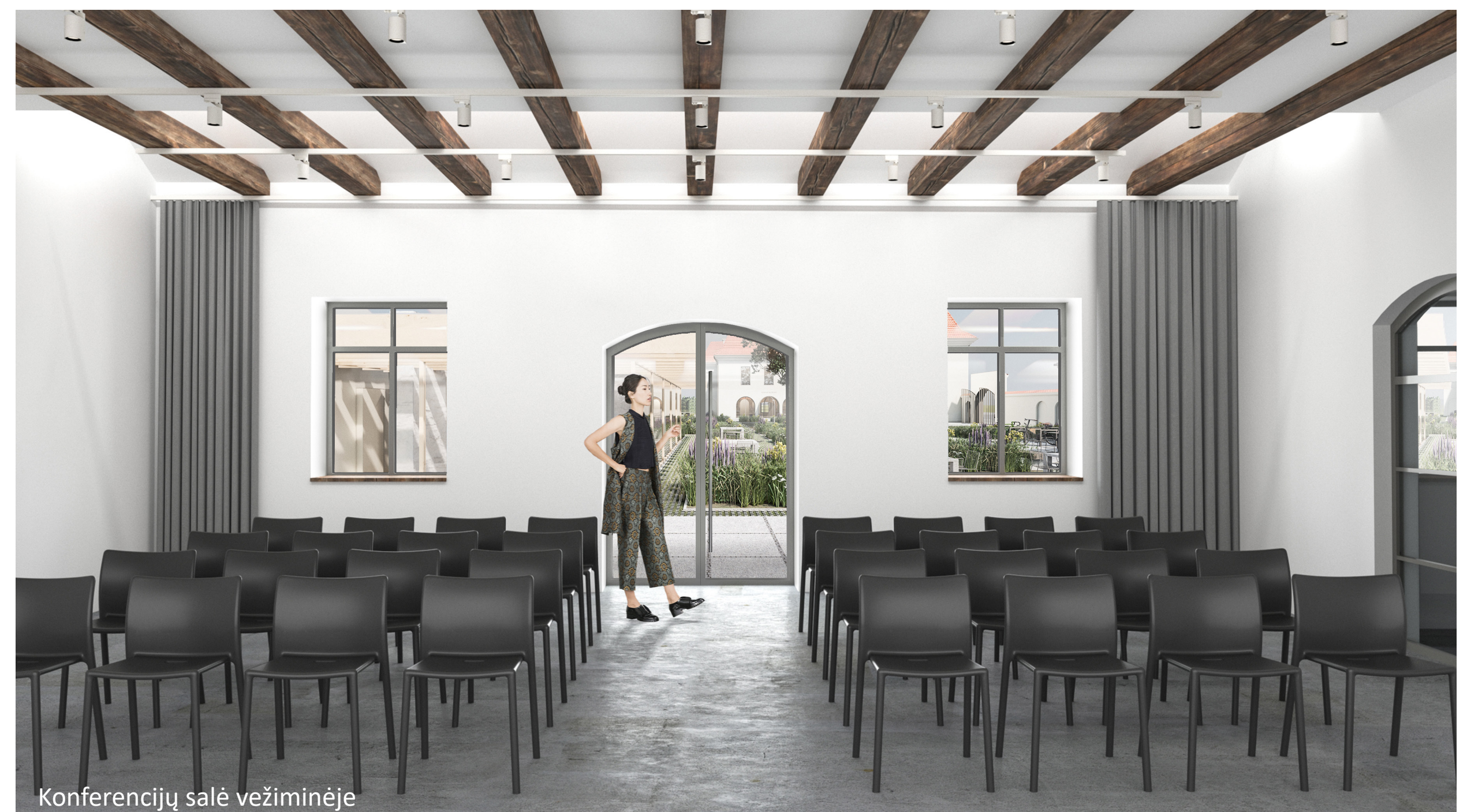
Konferencijų salė vežiminyje