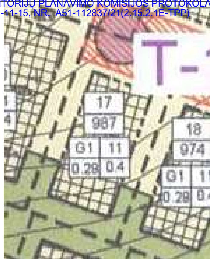
DETALIOJO PLANO PAGRINDINIO BRĖZINIO IŠTRAUKA