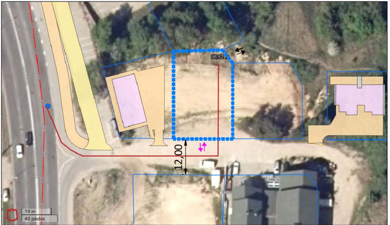
1pav. Lauko gaisrų gesinimas ( https://maps.vilnius.lt/teritoriju-planavimas )