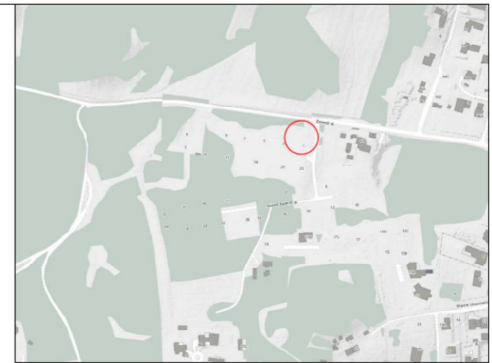
Projektuojamo sklypo vieta