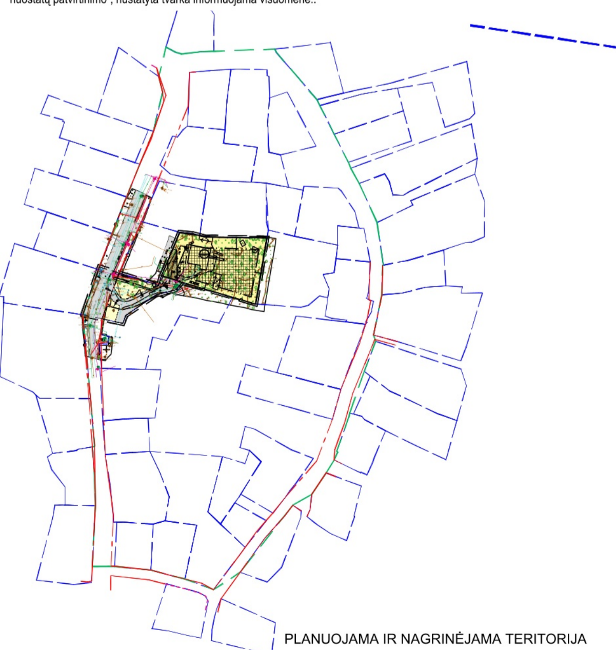
PLANUOJAMA IR NAGRINĖJAMA TERITORIJA