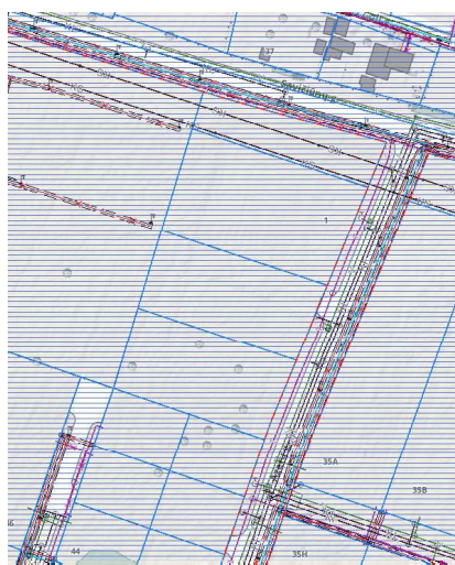
. Ištrauka iš Vilniaus miesto inžinerinių tinklų žemėlapis

Detaliojo plano koregavimo metu inžineriniai tinklai nėra koreguojami. Azerų gatvėje jau yra nutiesti visi reikalingi statybai inžineriniai tinklai, įrengti gaisriniai hidrantai.