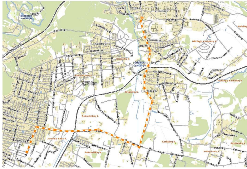
Maršrutas iki artimiausios priešgaisrinės gelbėjimo tarnybos 4-osios komandos

Artimiausia Priešgaisrinės gelbėjimo pajėgos yra Vilniaus m. priešgaisrinės gelbėjimo tarnybos 4-oji komanda (Pergalės g. 31, Naujoji Vilnia), nutolusi ~7, 5 km atstumu.