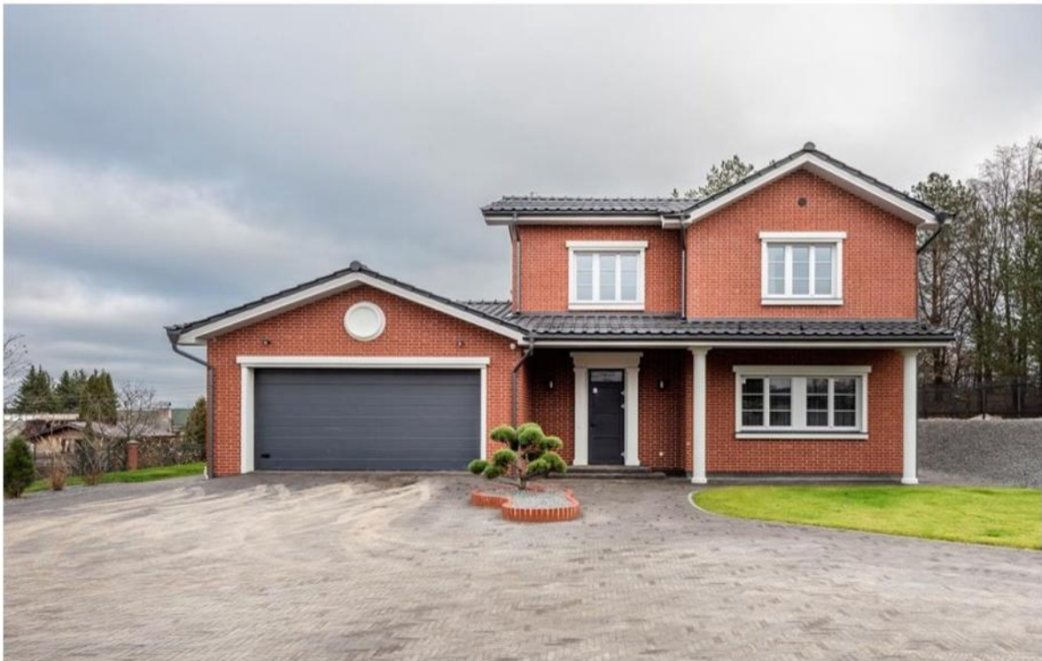
Esamas vienbutis gyvenamas namas

Pagrindinė žemės naudojimo paskirtis- kita; naudojimo būdas: Vienbučių ir dvibučių gyvenamųjų pastatų teritorijos. Plotas: 0,1120 ha.