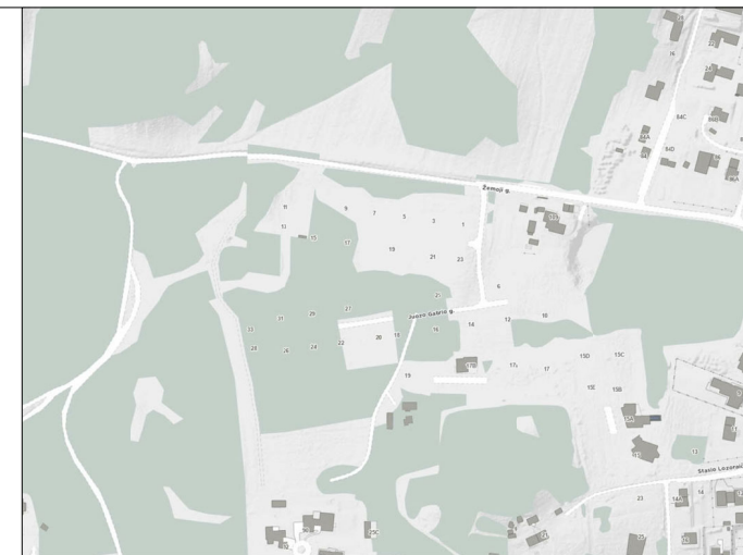
Projektuojamo sklypo vieta