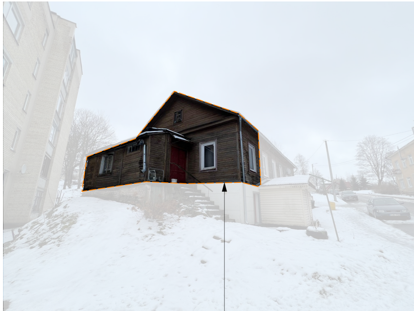
Vilniaus m., Naujininkų g. 12