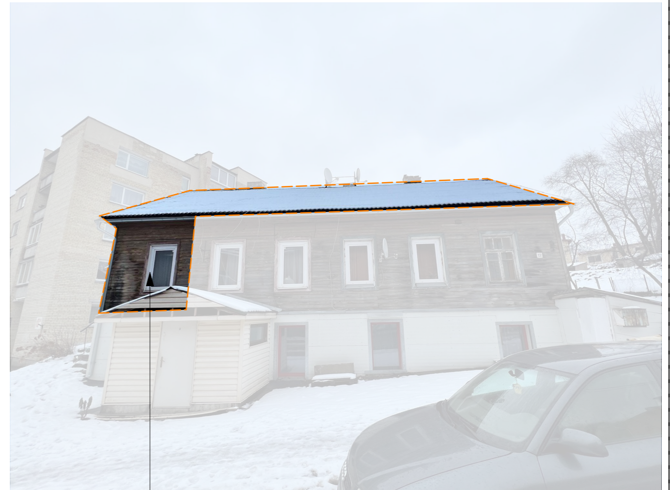
Vilniaus m., Naujininkų g. 12