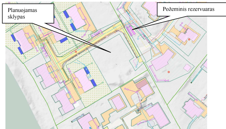
Ištrauka iš Vilniaus interaktyvaus žemėlapio

Artimiausias priešgaisrinio gelbėjimo pajėgų padalinys – Vilniaus apskrities Priešgaisrinė gelbėjimo valdyba, V-oji komanda, Kirtimų g. 37, Vilniuje. Atstumas – 6,86 km, atvykimo laikas – 18 min.