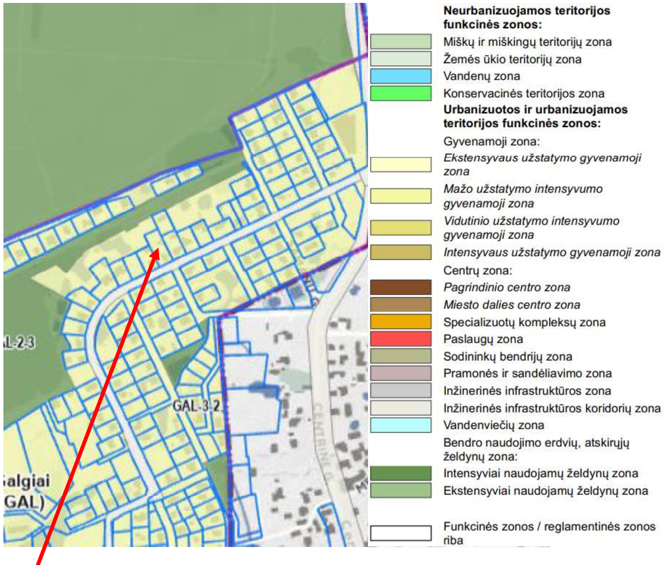
1 pav. Ištrauka iš Vilniaus miesto savivaldybės teritorijos bendrojo plano. Pagrindinis brėžinys

Pagal Vilniaus miesto savivaldybės teritorijos bendrojo plano (registro. Nr. T00086338) sprendinius žemės sklypas Žvaigždikių g. 20 patenka į mažo užstatymo intensyvumo gyvenamosios teritorijos funkcinę zoną. Tai mišrios teritorijos, kuriose dominuoja gyvenamoji veikla (mažaaukštė vienbutė, dvibutė gyvenamoji statyba), kartu su jos aptarnavimui reikalinga socialine, paslaugų ir kita infrastruktūra.