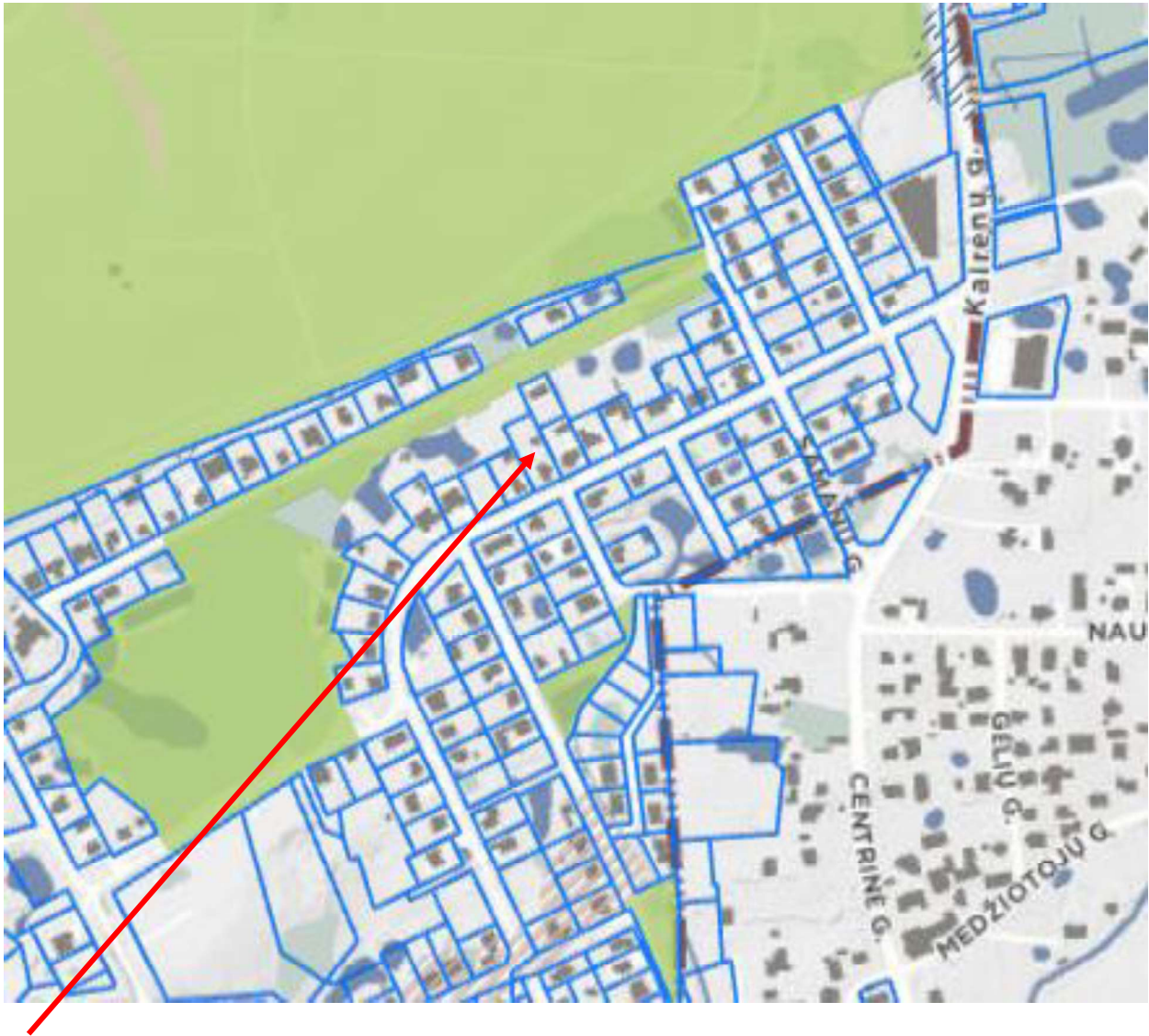
3 pav. Ištrauka iš Vilniaus miesto savivaldybės teritorijos bendrojo plano. Gamtinio karkaso geomorfologiniai elementai.

37- Teritorijai ar jos daliai (pagal BP brėžinį Geomorfologiniai gamtinio karkaso elementai) taikyti Pelkinių lygumų apsaugos ir tvarkymo reglamentą;