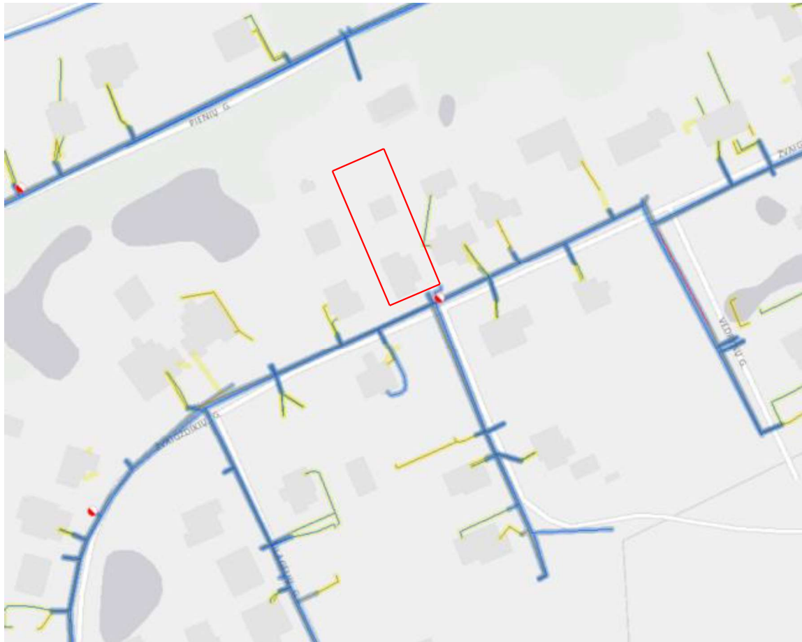
4 pav. Ištrauka iš vandenys.maps.arcgis.com

Lauko gaisrų gesinimui greta planuojamos teritorijos Žvaigždikių gatvėje yra įrengtas priešgaisrinis hidrantas, atstumas iki kurio yra ne didesnis kaip 200 m.