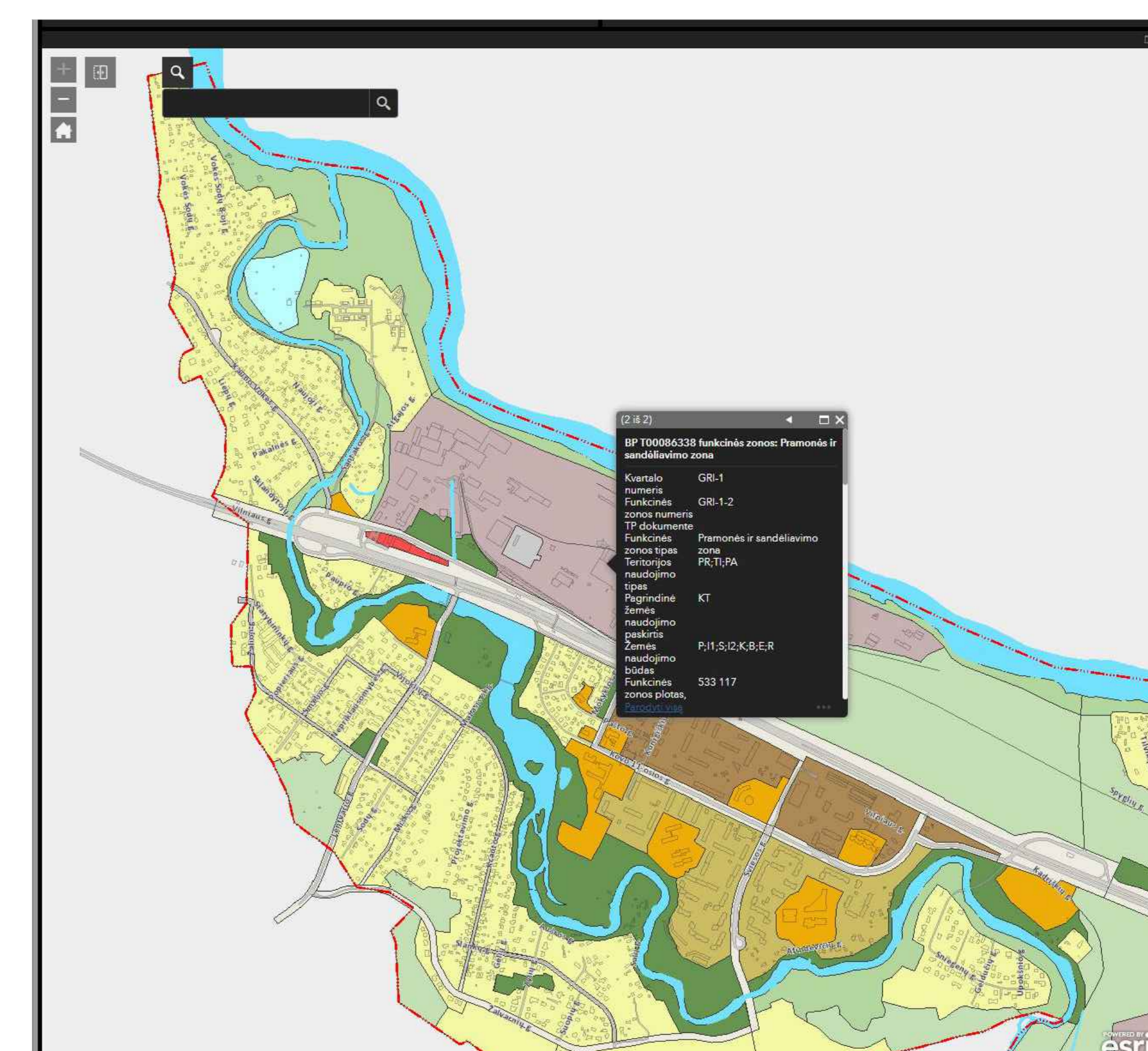
Žemės sklypo, Vilniaus g. 10, Grigiškės, Vilniaus m. sav., situacija Vilniaus miesto savivaldybės teritorijos bendrajame plane (TPD registracijos Nr. T00066338). www.vilniaus.lt