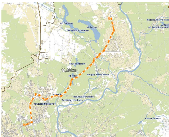
2 pav. Maršrutas iki artimiausios priešgaisrinės gelbėjimo tarnybos 3-osios komandos

Anksčiau patvirtintame detalajame plane statybos zona ir ribos nėra keičiamos. Sklype statomas gyvenamasis pastatas atitiks Gaisrinės saugos pagrindinius reikalavimus. Artimiausia Priešgaisrinės gelbėjimo pajėgos yra Vilniaus m. priešgaisrinės gelbėjimo tarnybos 3-oji komanda (Ateities g. 17), nutolusi 11,4 km atstumu (žr. 2 pav.).