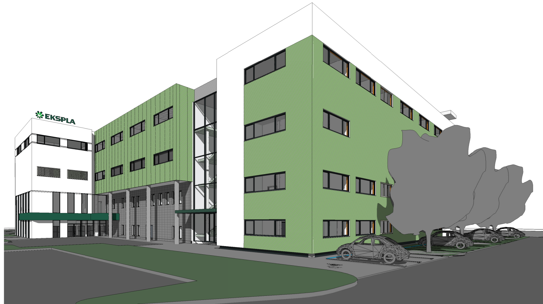
2 Iš pagrindinio kiemo pusės