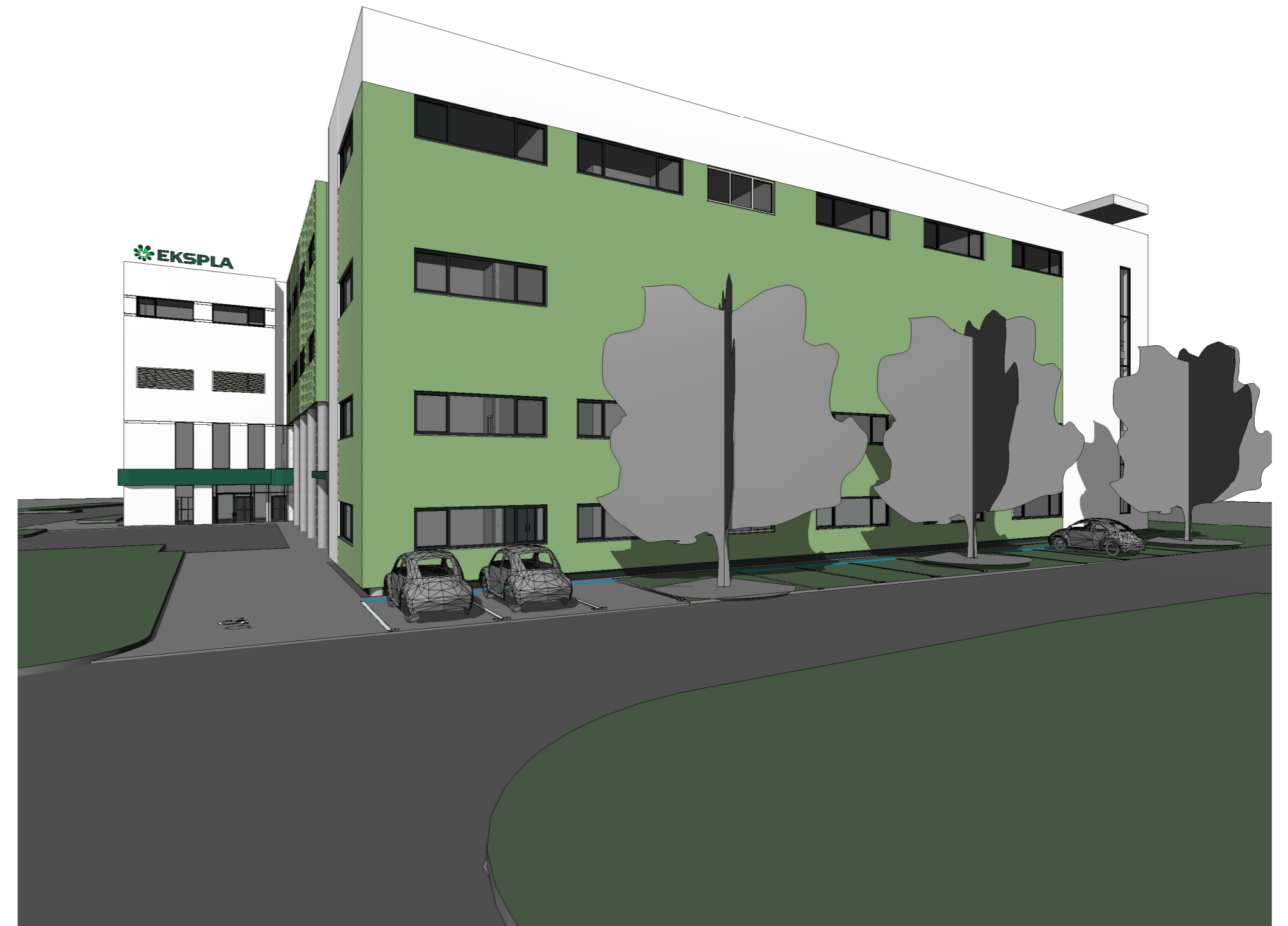
1 Nuo įvažiavimo pusės