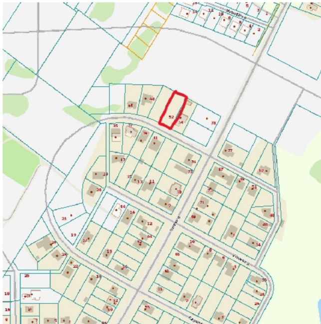
1 pav. Planuojamos teritorijos schema.