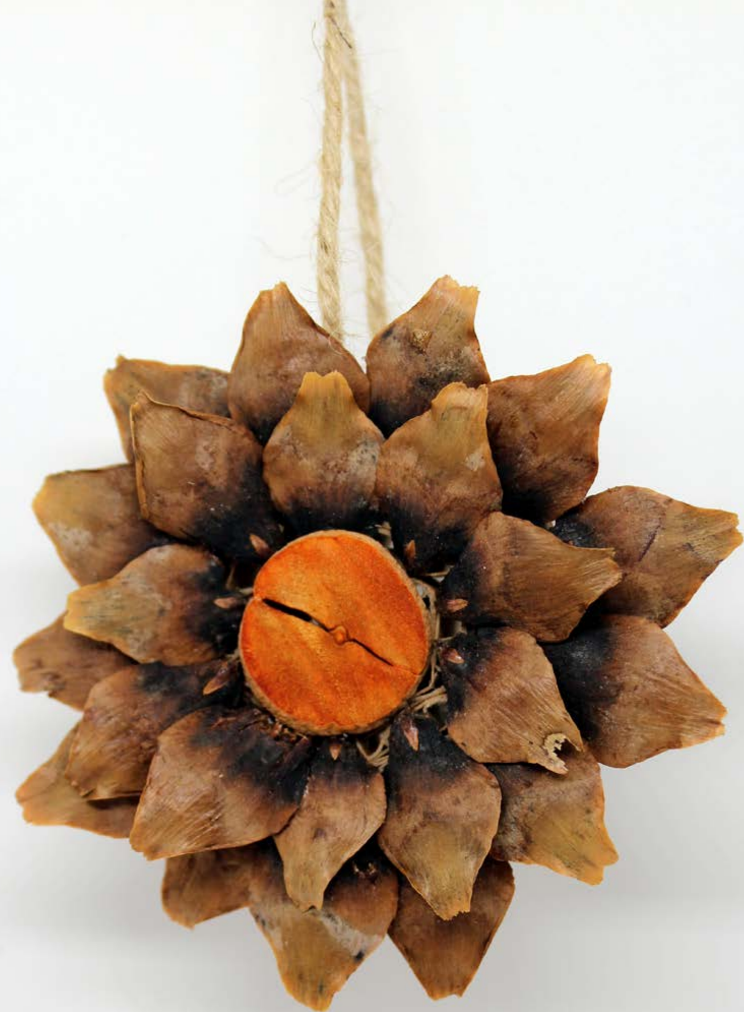
Vilniaus vaikų ir jaunimo klubas "Meteoras"