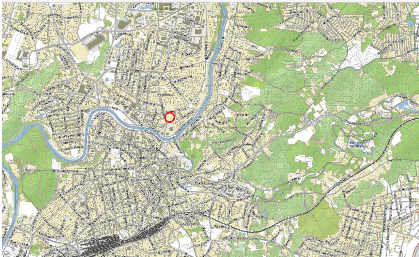
Situacijos schema Vilniaus mieste