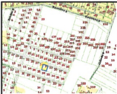
Situacijos schema ŠATRINKŲ G. 31, VILNIUS

Vilniaus miesto savivaldybės administracijos Miesto plėtros departamentas TERITORIJŲ PLANAVIMO KOMISIJA 2019-02-13/14 PRCT. NR. 1-2/19-8 GIS NR. 7