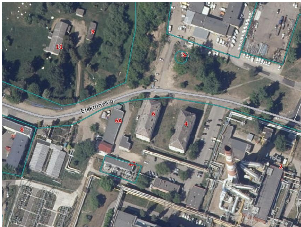
1 pav. Situacijos schema.