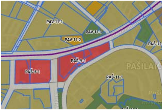
Ištrauka iš BP. Funkcinės zonos

Sklypas patenka į gamtinio karkaso vietinį vidinio stabilizavimo arealą, vietinį migracijos koridorių