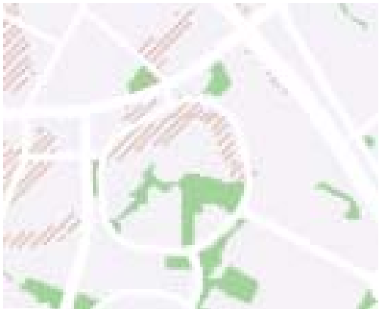
Ištrauka iš BP. Ištrauka iš geomorfologinių karkaso elementų brėžinio.

Sklypui taikomas Sausaslėnių apsaugos ir tvarkymo reglamentas.