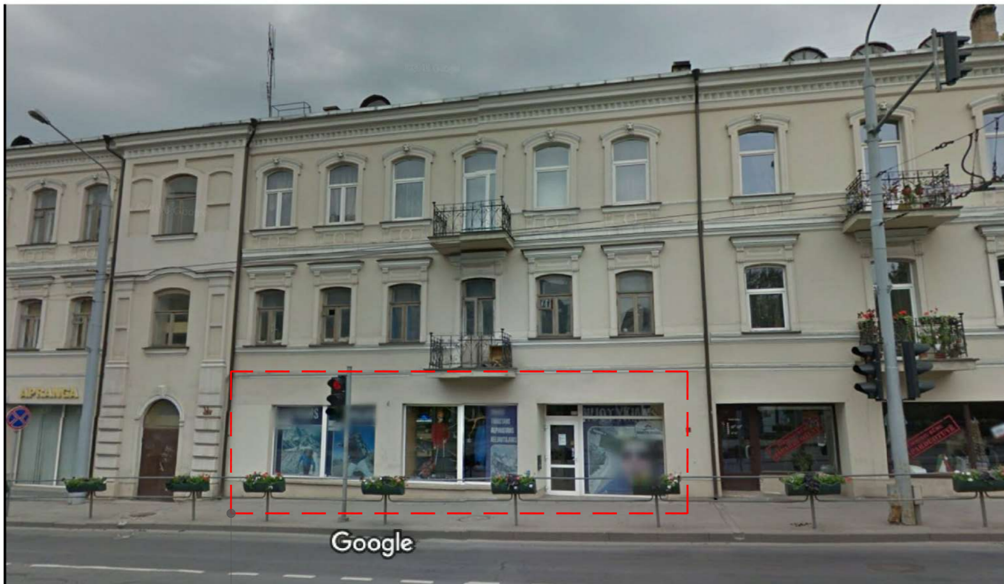
KALVARIJŲ G. FASADAS