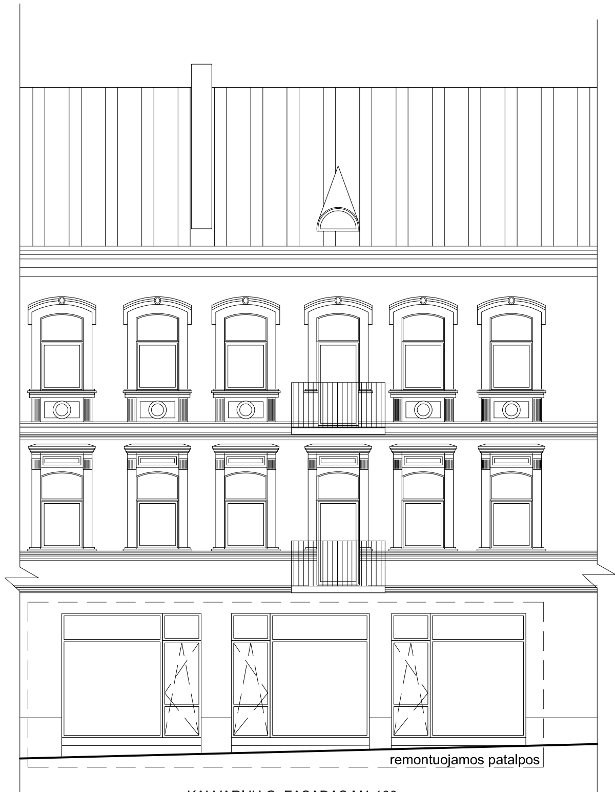
KALVARIJŲ G. FASADAS M1:100