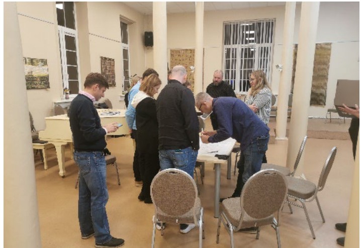
1 pav. Darbas grupėse viešos konsultacijos metu

Šiame dokumente pateikiame diskusijų grupių apibendrintą pasiūlymų sąrašą kartu su nuotraukomis iš „Google Street View“ ir žymėjimu žemėlapyje (žr. 2 pav.). Pasiūlymai surikiuoti pagal tako atkarpas nuo projektuojamo dviračių tako pradžios ties M. K. Oginskio g. iki pabaigos ties Saulėtekio alėja.