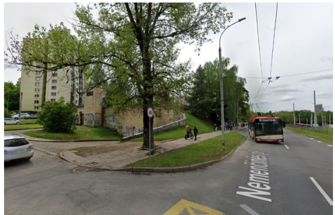
8 pav. Tuopa šaligatvio viduryje

6) šaligatvio viduryje augančią tuopą prašoma bandyti išsaugoti (žr. 8 pav.). Šalinti tik kraštutiniu atveju.