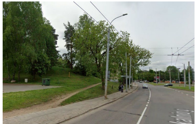
5 pav. Kalvelė ir uosialapiai klevai

IV. Raudonos spalvos atkarpoje yra probleminė, siaura vieta dėl VT stotelės „Nemenčinės pl.“ (žr. 6 pav.) ir parkavimo aikštelės (žr. 7 pav.). Čia buvo sulaukta kelių skirtingų gyventojų pasiūlymų: