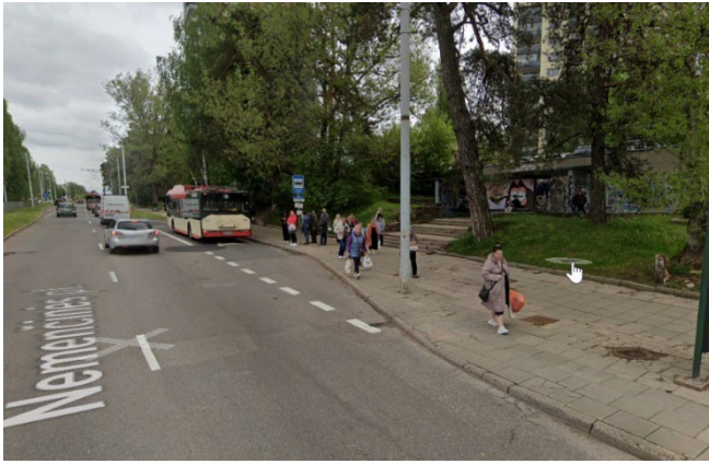
6 pav. Stotelė „Nemenčinės pl.“