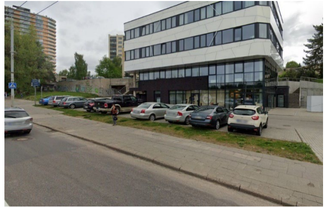
7 pav. Parkavimo aikštelė

3) panaikinti „Nemenčinės pl.“ stotelės įvažą ir vieną iš dviejų esamų juostų skirti autobusams. Tuo pačiu buvo prieštaraujančių, sakančių kad „A“ juosta čia nereikalinga, kadangi autobusai nevēluoja ir spūstys nesusidaro;