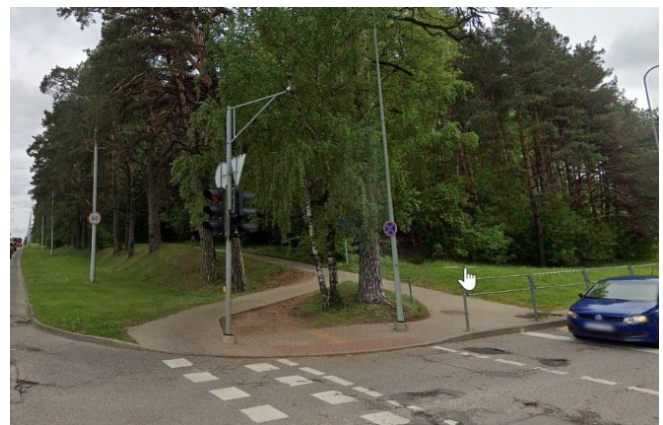
9 pav. Asfaltuotas pėsčiųjų takas tarp medžių.

einantis tarp medžių (žr. 9 pav.). Buvo gautas gyventojų pasiūlymas šioje atkarpoje įrengti du takus. Laisvame plote palei gatvę įrengti dviračių taką greitajam važiavimui, o tarp medžių esantį takelį praplatinti ir palikti bendrą dviračių ir pėsčiųjų taką. Bendras takas būtų skirtas rekreacinėms kelionėms ir mažo greičio judėjimui, taip pat gyventojai norėtų, kad prie tako būtų įrengti suoliukai.