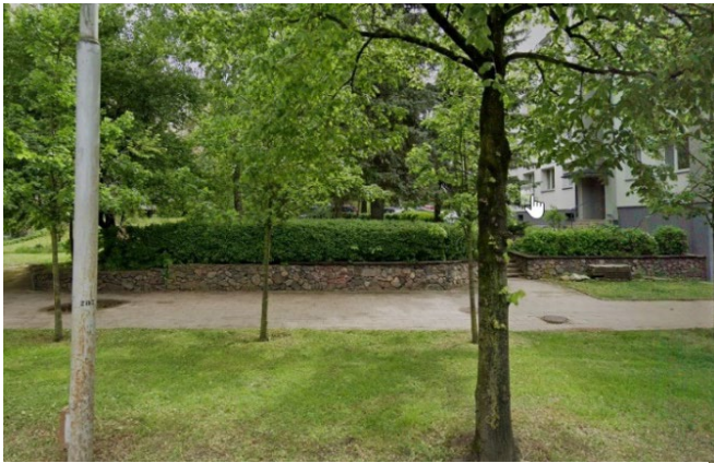
3 pav. Atraminė sienelė ir jauni medžiai