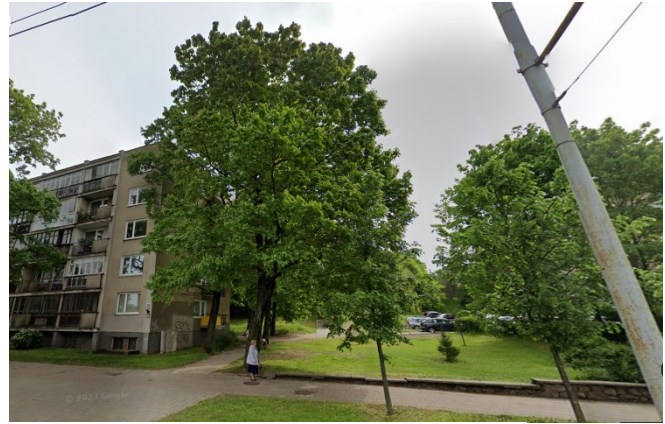
4 pav. Klevas prie pėsčiųjų perėjos į ligoninę

II. Baltos spalvos atkarpoje yra „Antakalnio“ viešojo transporto (toliau – VT) stotelė. Buvo gauti gyventojų siūlymai: