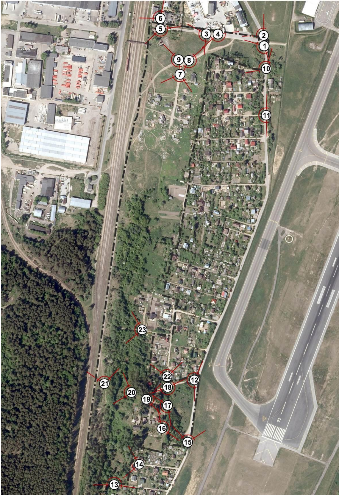
Foto fiksacijų schema