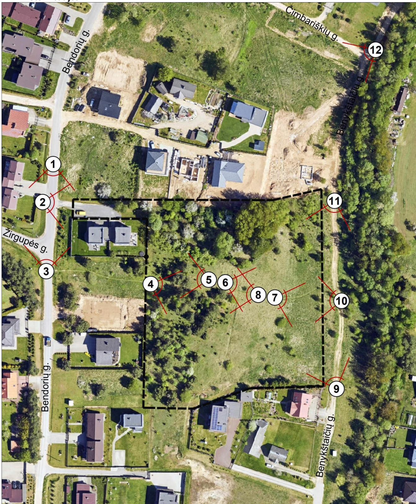
Foto fiksacijų schema