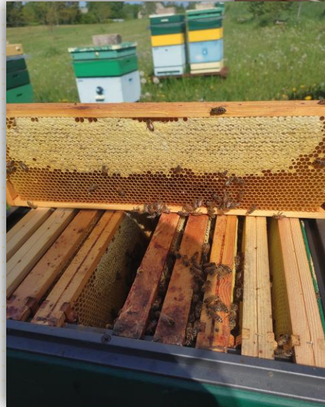
Medaus koriai avilyje