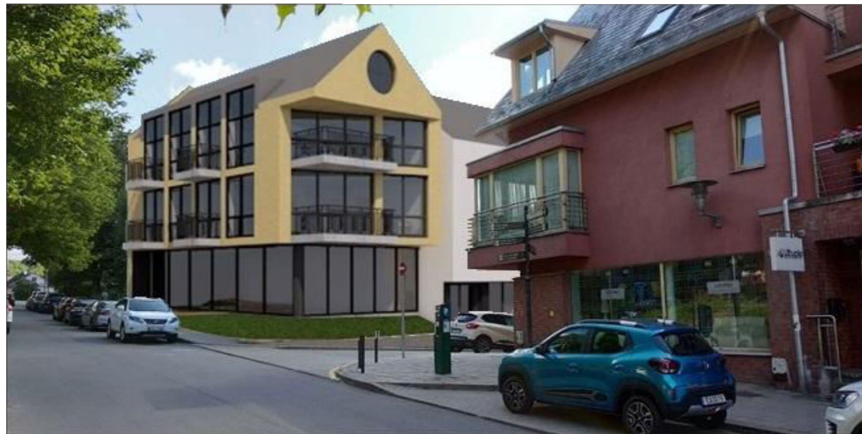
Krivių gatvės perspektyva