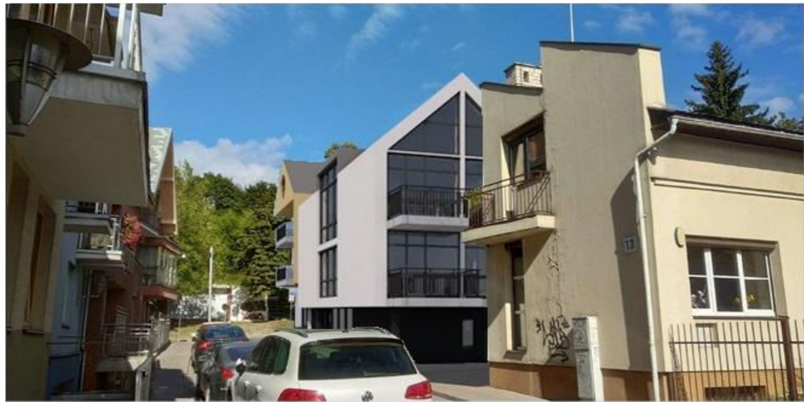
Baltojo skersgatvio perspektyva