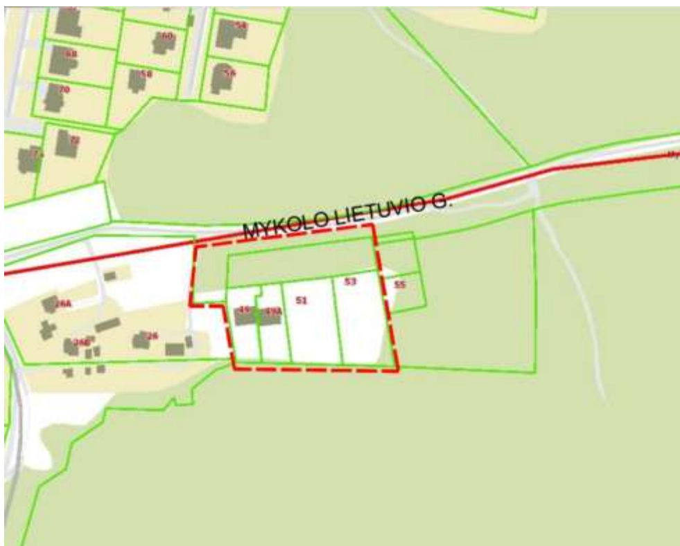
1 pav. Situacijos schema

Kitos daiktinės teisės : Kiti servitutai (tarnaujantis). Savininkai privalo leisti tiesti inžinerinius tinklus ir juos eksploatuoti.