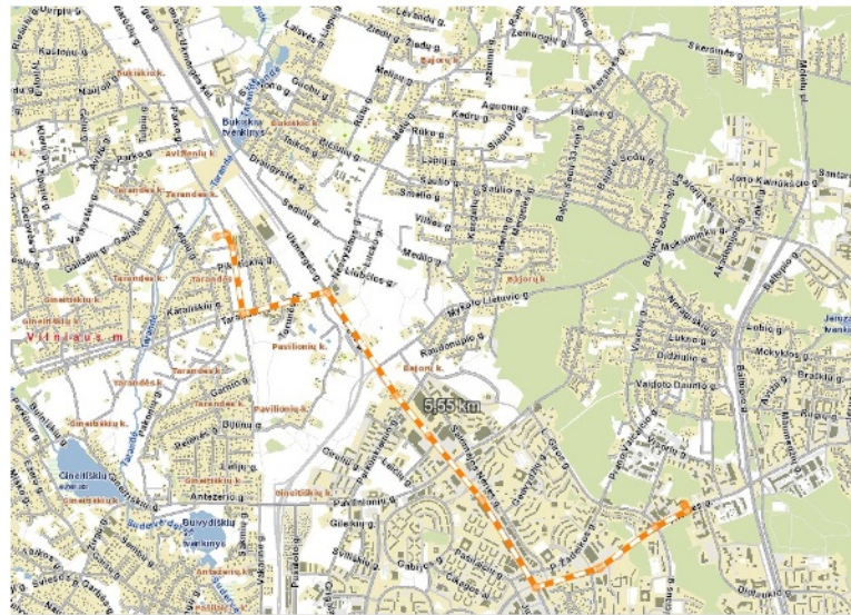
2 pav. Maršrutas iki artimiausios priešgaisrinės gelbėjimo tarnybos 3-osios komandos

Sklypo (kadastru Nr. 4103/0600:12) Tarandėje nedidelių veiklos mastų detaliojo plano koregavimas sklype, kad. Nr. 0101/0171:1813 (statybos zonos, ribų, susisiekimo komunikacijų ir aprūpinimo inžineriniais tinklais koregavimas)