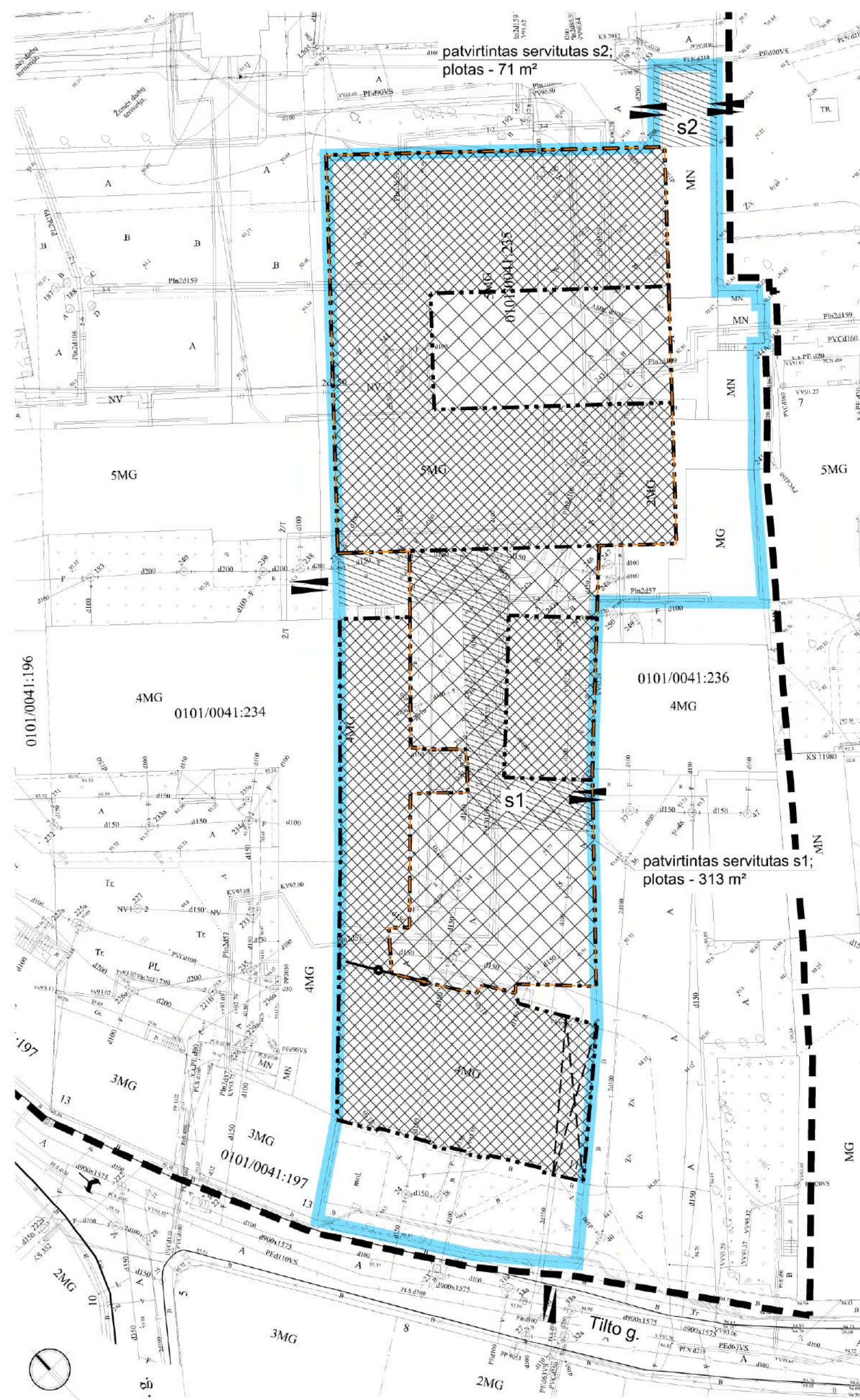
SHEMA NR. 1

TERITORIJOS TARP ŽYGMANTŲ, RADVILŲ IR TILTO GATVIŲ DETALIUOJU PLANU NUSTATYTOS STATYBOS ZONOS, RIBOS, SERVIDITAI, ĮVAŽIAVIMAI IR IŠVAŽIAVIMAI