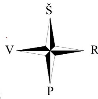
Situacijos išdėstymo schema