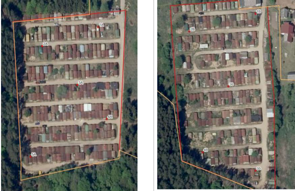
3 pav. Ekogeologinio tyrimo gręžinių vietos

Vertinant atliktus tyrimus pagal Lietuvos Geologijos tarnybos parengtą metodiką, t. y. taršos pavojingumo vertinimą (TPV), teritorijoje nėra didelės grunto taršos rizikos bei nėra poreikio atlikti detalų ekogeologinį tyrimą. Teritorijoje nugriovus likusius garažus ir užfiksavus vizualią taršą, rekomenduojama atlikti papildomus-kontrolinius ekogeologinius tyrimus.