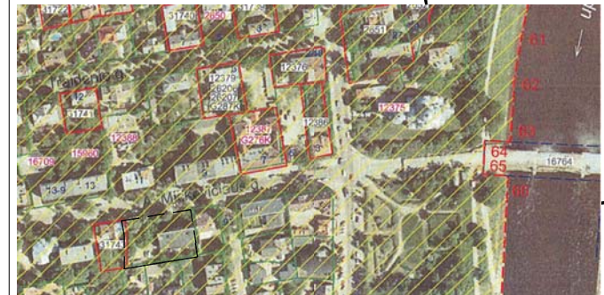
Ištrauka iš Vilniaus miesto istorinės dalies, vad. Žvėrynu, apibrėžtų teritorijos ribų plano