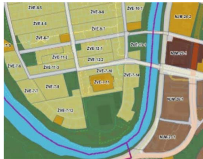
Ištrauka iš Vilniaus miesto savivaldybės teritorijos bendrojo plano pagrindinio brėžinio iki 2030