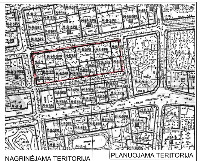
NAGRINĖJAMA TERITORIJA PLANUOJAMA TERITORIJA