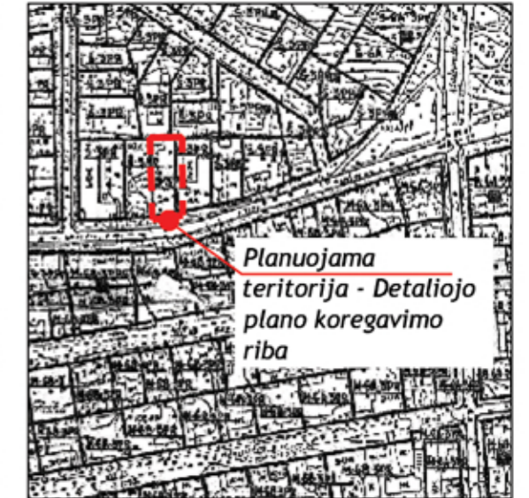
Ištrauka iš patvirtinto Žvėryno rajono plano

Planuojama teritorija: Sklypas Latvių g. 9 (kadastro Nr. 0101/0031:404), Žvėryno seniūnija. Planavimo uždaviniai: Koreguoti Vilniaus miesto valdybos 1995 m. sausio 12 d. sprendimu Nr. 82V "Dėl Žvėryno rajono plano tvirtinimo" patvirtinto Žvėryno rajono plano (registro Nr. T00054568) sprendinius teritorijų planavimo proceso inicijavimo pagrindu: pakeisti mažaaukščių gyvenamųjų namų statybos naudojimo būdą į daugiabučių gyvenamųjų namų ir bendrabučių teritorijos naudojimo būdą (G2), nustatyti užstatymo intensyvumą, užstatymo tankį, statinių aukštį ir kitus teritorijos naudojimo reglamentus, neviršijant Vilniaus miesto savivaldybės teritorijos bendrajame plane (registro Nr. T00086338) nustatytų užstatymo reglamentų. Papildomi planavimo uždaviniai: Numatyti funkcinius bei kompozicinius ryšius su gretimomis teritorijomis, suformuoti optimalią urbanistinę struktūrą. Papildomi reglamentai: Teritorijos tūrinės ir erdvinės kompozicijos reikalavimai, susisiekimo komunikacijų išdėstymas.