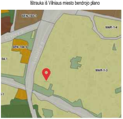
Ištrauka iš Vilniaus miesto bendrojo plano

SU PROJEKTO SPRENDINIAIS SUTINKU IR TVIRTINU: