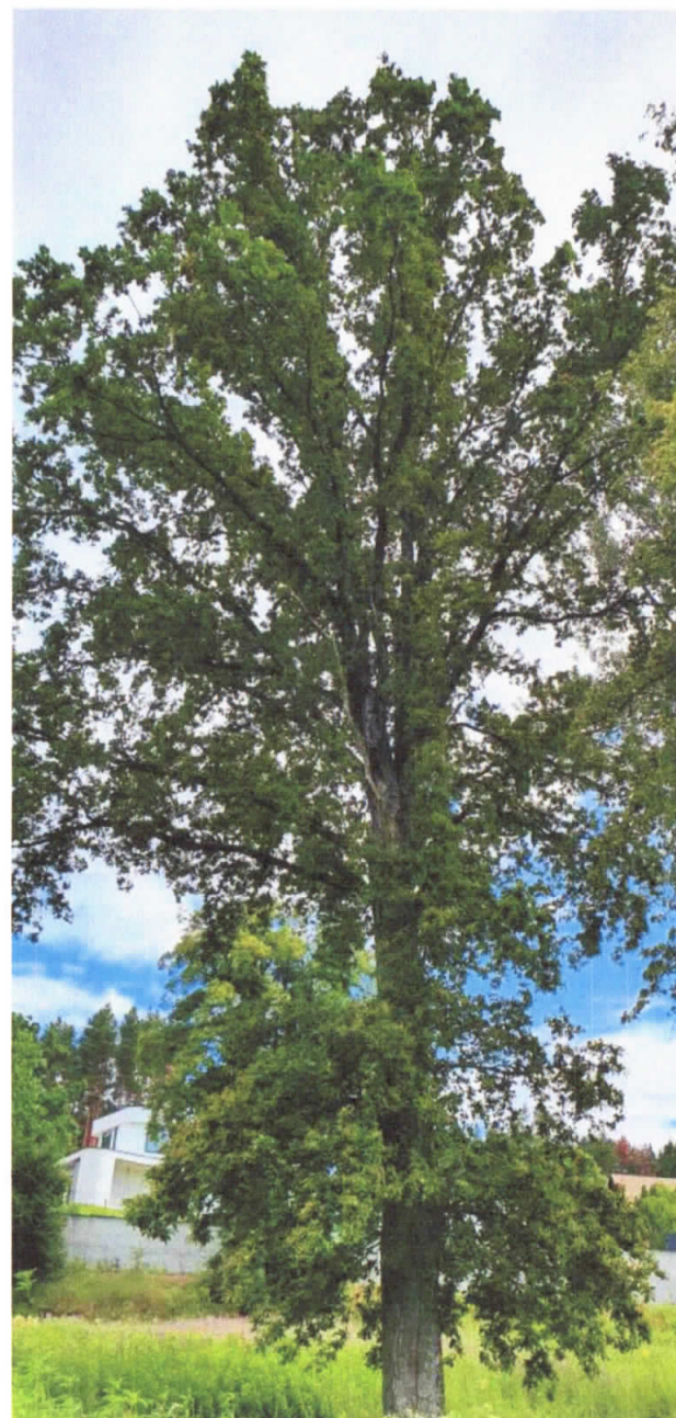
AŽUOLAS (Brėžinyje Nr1)