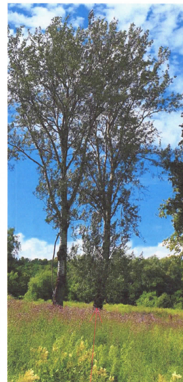
DREBULĖ (Brėžinyje Nr3)