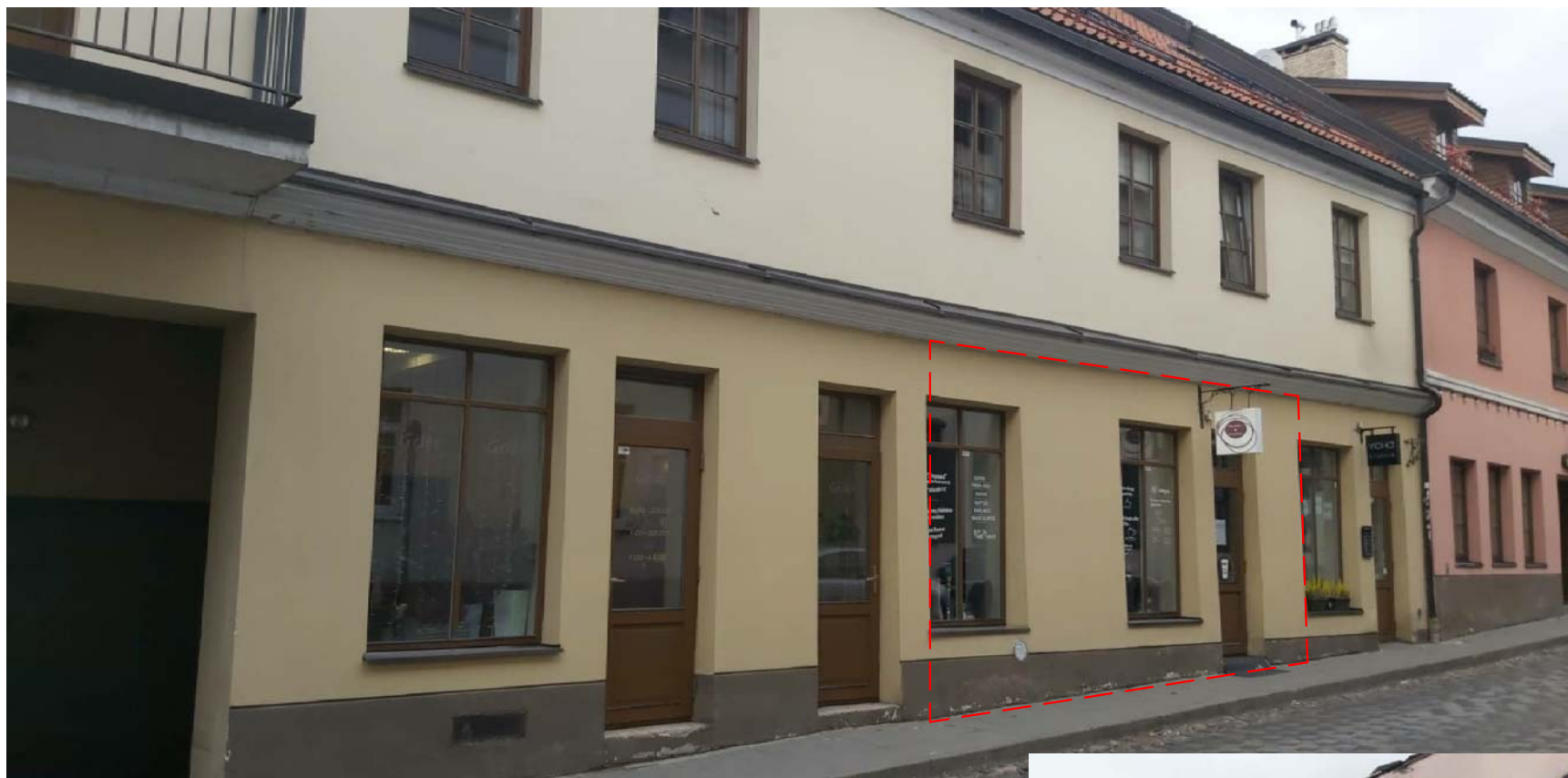
----- Keičiamų patalpų vaizdas nuo Užupio gatvės