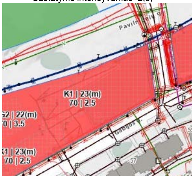
Ištrauka iš Vilniaus m. skaitmeninių žemėlapių