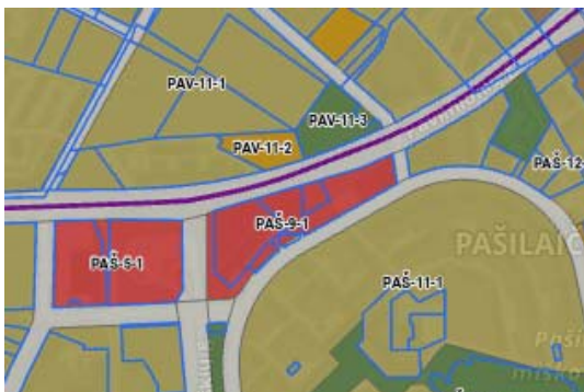
Ištrauka iš BP. Funkcinės zonos

Pagal galiojančią Vilniaus miesto bendrąjį planą (TPD registracijos Nr. T00086338, galioja nuo 2021-06-08), planuojamas sklypas patenka į paslaugų zoną PAŠ-9-1 (pagal funkcinį zonavimą).