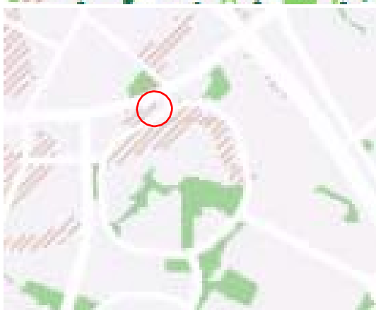
Ištrauka iš BP. Ištrauka iš geomorfologinių karkaso elementų brėžinio.

Sklypui taikomas Sausaslėnių apsaugos ir tvarkymo reglamentas.