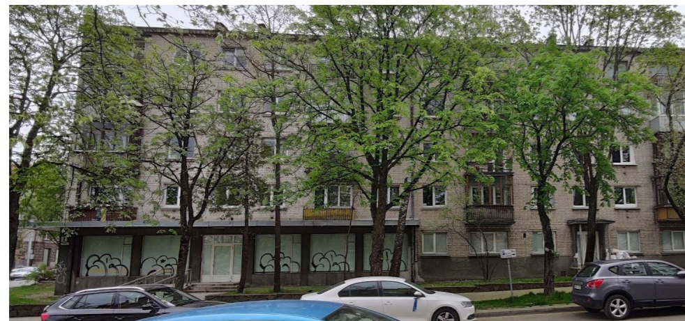
esamos būklės fotofiksacija