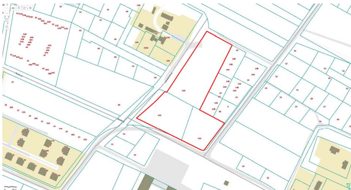
Pav. Nr.1 - Planuojamos teritorijos schema

Planuojama teritorija: trys žemės sklypai Juodupio g. 140, Vilniuje (kadastro Nr. 0101/0158:1751), Juodupio g. 142, Vilniuje (kadastro Nr. 0101/0158:1753) ir Juodupio g. 146, Vilniuje (kadastro Nr. 0101/0158:1752) yra rytinėje Vilniaus miesto dalyje, Naujosios Vilnios sen. Teritorijos plotas 1,3 ha.