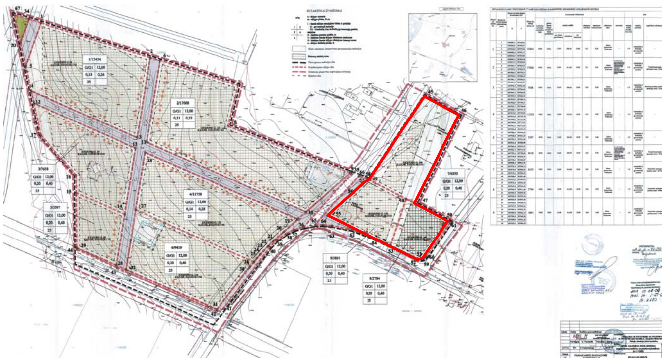
Pav. Nr.2 – Ištrauka iš galiojančio detaliojo plano pagrindinio brėžinio