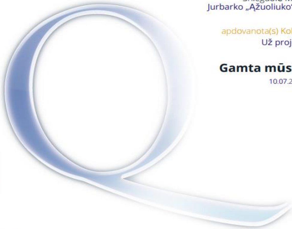
Daiva Šutinytė Nacionalinė paramos tarnyba Lietuva