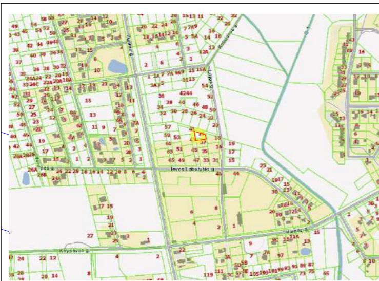
Žemės sklypo situacijos schema

1 680 Gyvenamoji teritorija GG G/G1 12 33 0.40 lp 25