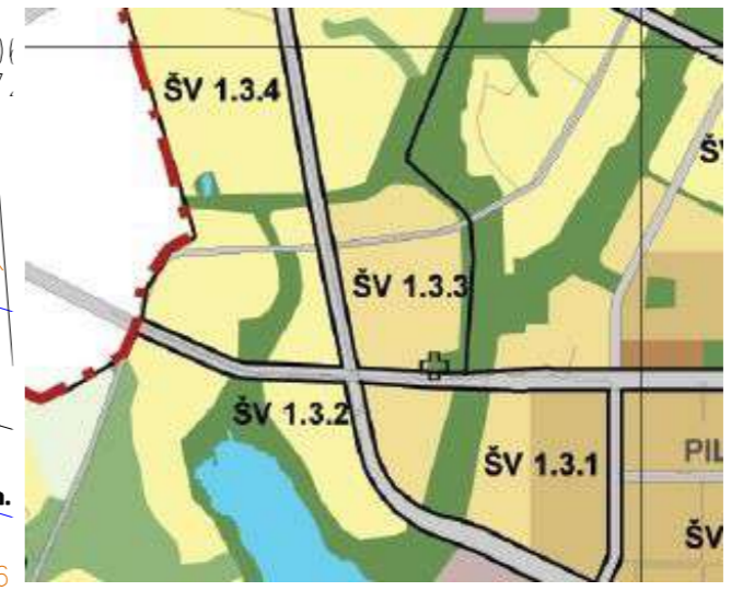
ĮSTRAUKA IŠ VILNIAUS SAVIVALDYBĖS TERITORIJOS BENDROJO PLANO