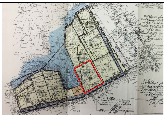
KOREGUOJAMO SKLYPO SITUACIJA