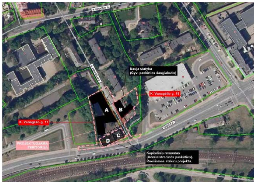
„DO ARCHITECTS“ PP projektuojamo užstatymo schema su gretimbėmis

Architektų studijos „DO ARCHITECTS“ projektinių pasiūlymų medžiaga pristatyta visuomenei: https://vilnius.lt/lt/numatomo-statiniu-projektavimo-viesumas/daugiabucio-gyvenamojo-namo-vanagelio-g-11-ir-18-vilniuje-statybos-projekto-projektiniu-pasiulymu-pristatymas/ iliustruoja kuriamo naujo užstatymo papildymą buvusio istorinio priemiesčio teritorijoje.