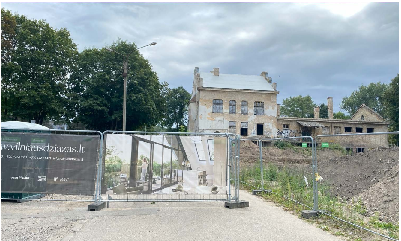
Vaizdas iš K.Vanagėlio g.

Planuojama teritorija patenka į saugomų vietovių - Vilniaus senamiesčio u.k. 16073 teritoriją ir Vilniaus senojo miesto vieta su priemiesčiais u. k. 25504 archeologinės vietovės teritorijas. Sklype K.Vanagėlio g. 11 (DP NR. 2) pietinėje dalyje yra u.o. k. 30645 vertybės teritorija.