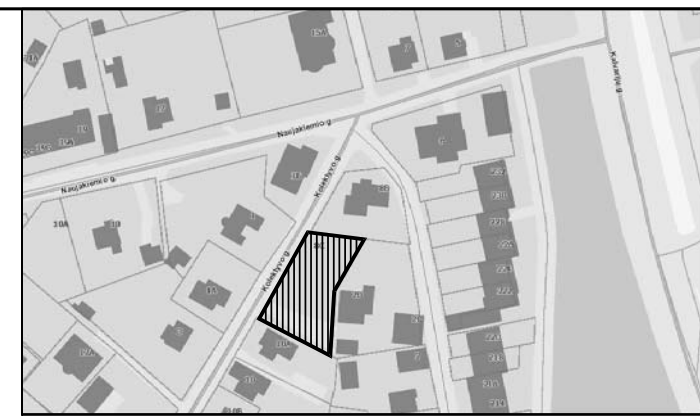
PLANUOJAMOS TERITORIJOS VIETA