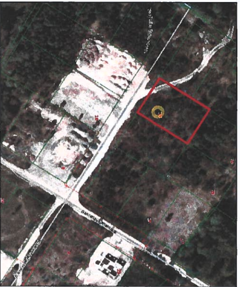
Sklypo išdėstymo schema M 1:2500