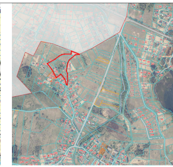
Vilniaus m. savivaldybės bendrojo plano ištrauka