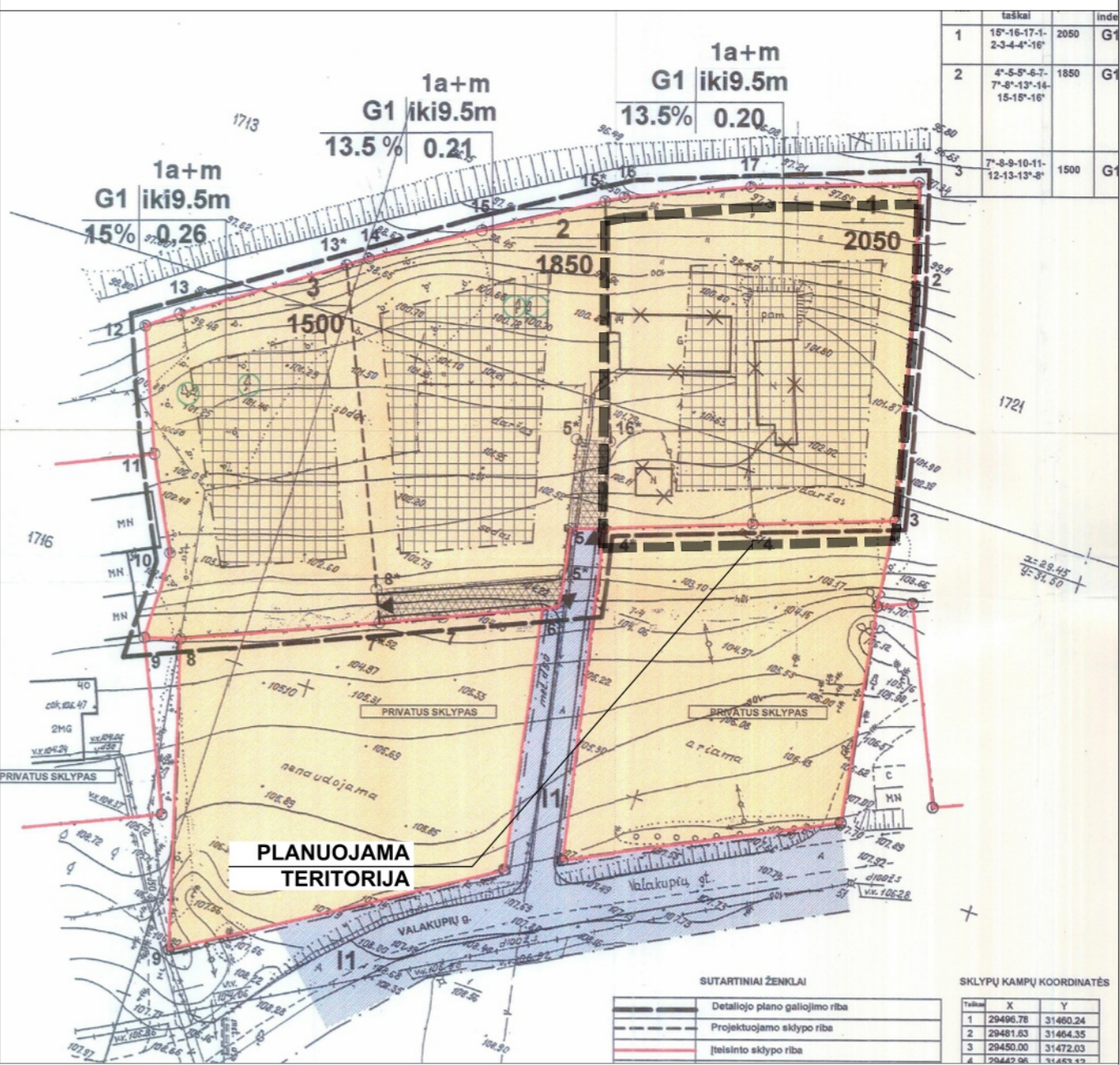
KOREGUOJAMAS DETALUSIS PLANAS