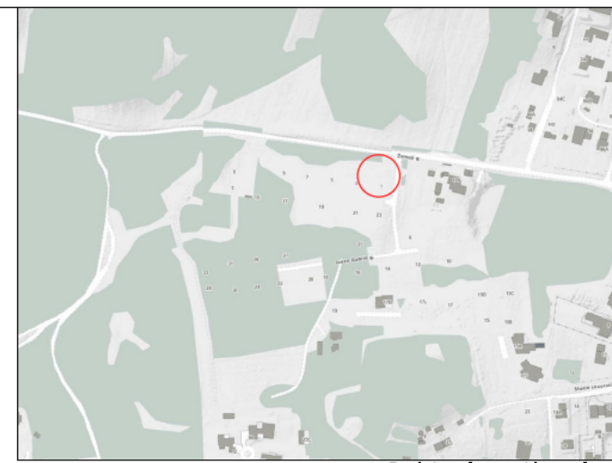
Projektuojamo sklypo vieta